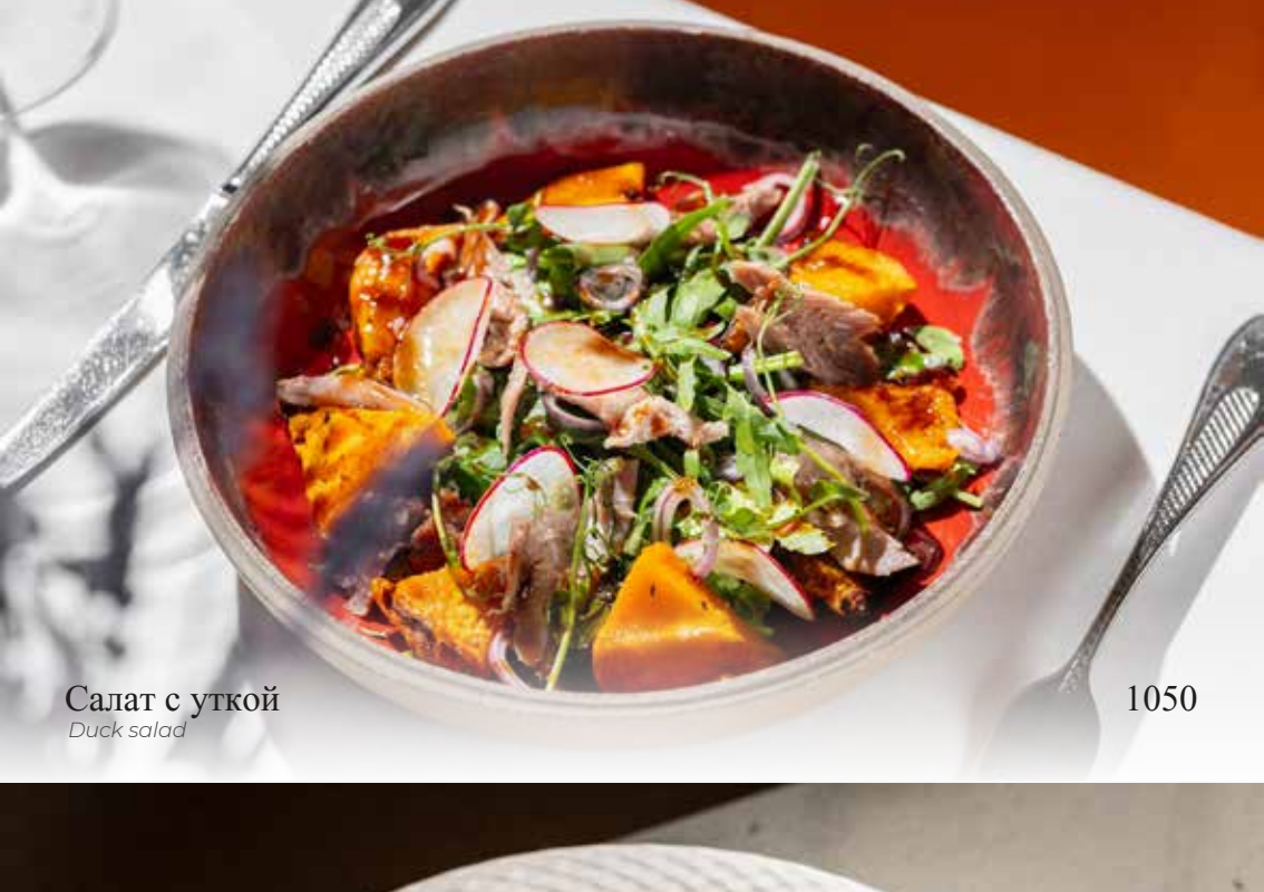
Салат с уткой Duck salad