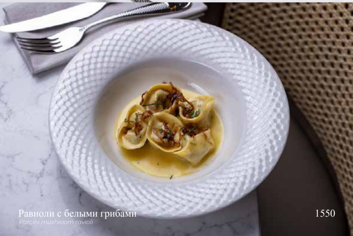
Равиоли с белыми грибами