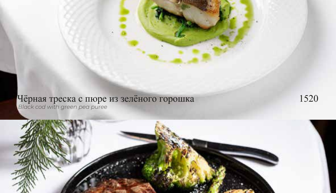
Рибай с овощами на гриле Ribeye with grilled vegetables