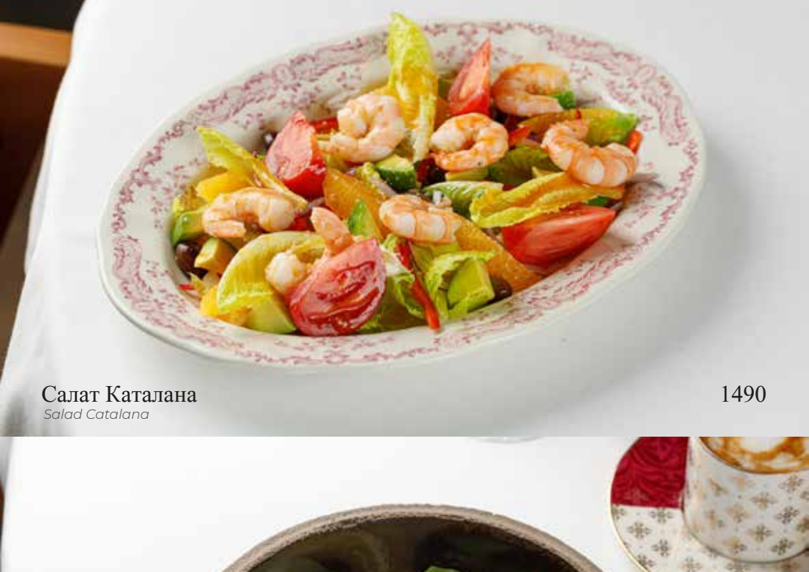
Салат Каталана Salad Catalana