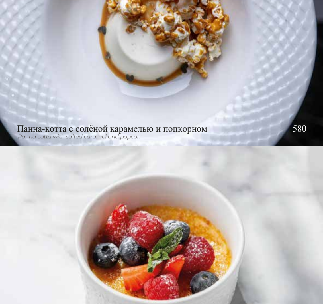
Панна-котта с солёной карамелью и попкорном Panna-cotta with salted caramel and popcorn