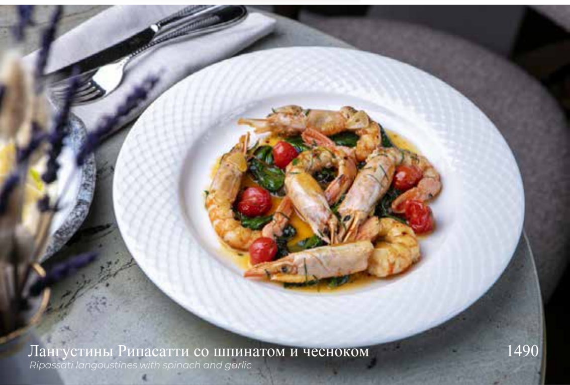
Лангустины Рипассати со шпинатом и чесноком Ripassati langoustines with spinach and garlic