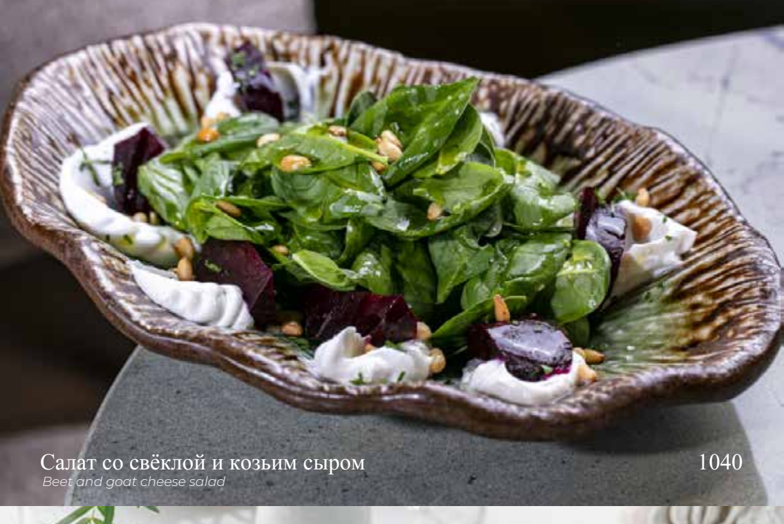
Салат со свёклой и козьим сыром Beet and goat cheese salad