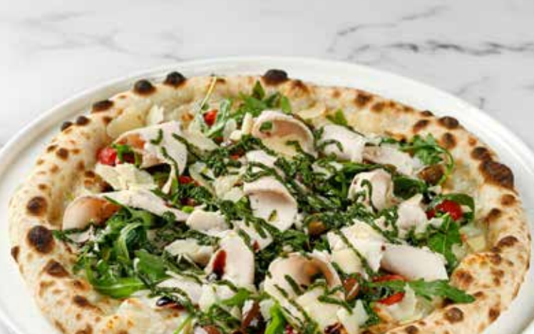
Пицца с курицей