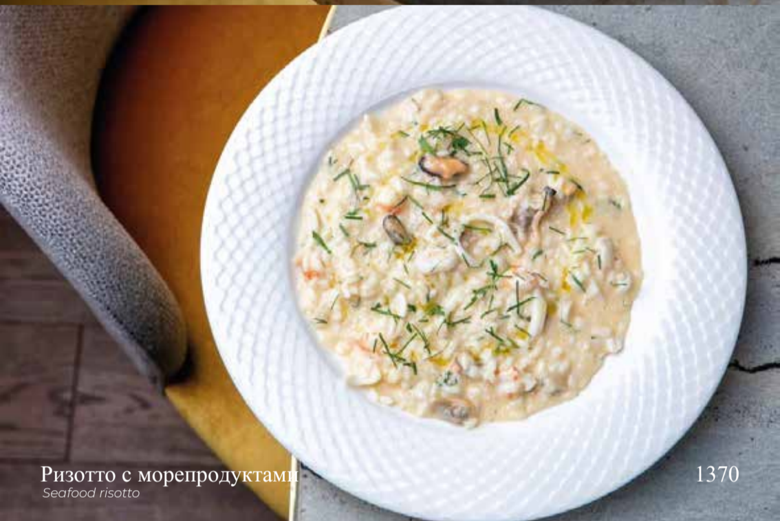
Ризотто с морепродуктами