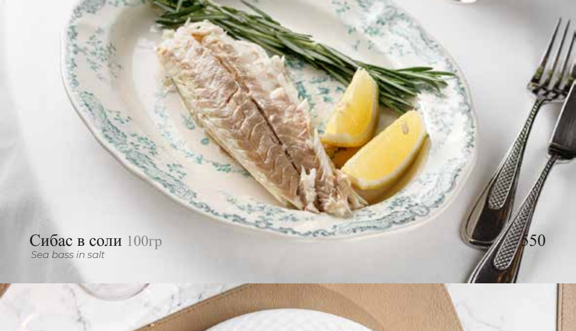
Сибас в соли 100гр Sea bass in salt