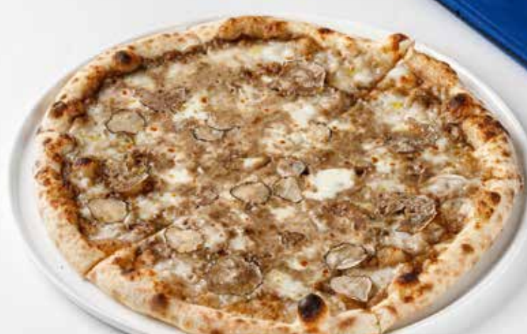
Пицца с чёрным трюфелем