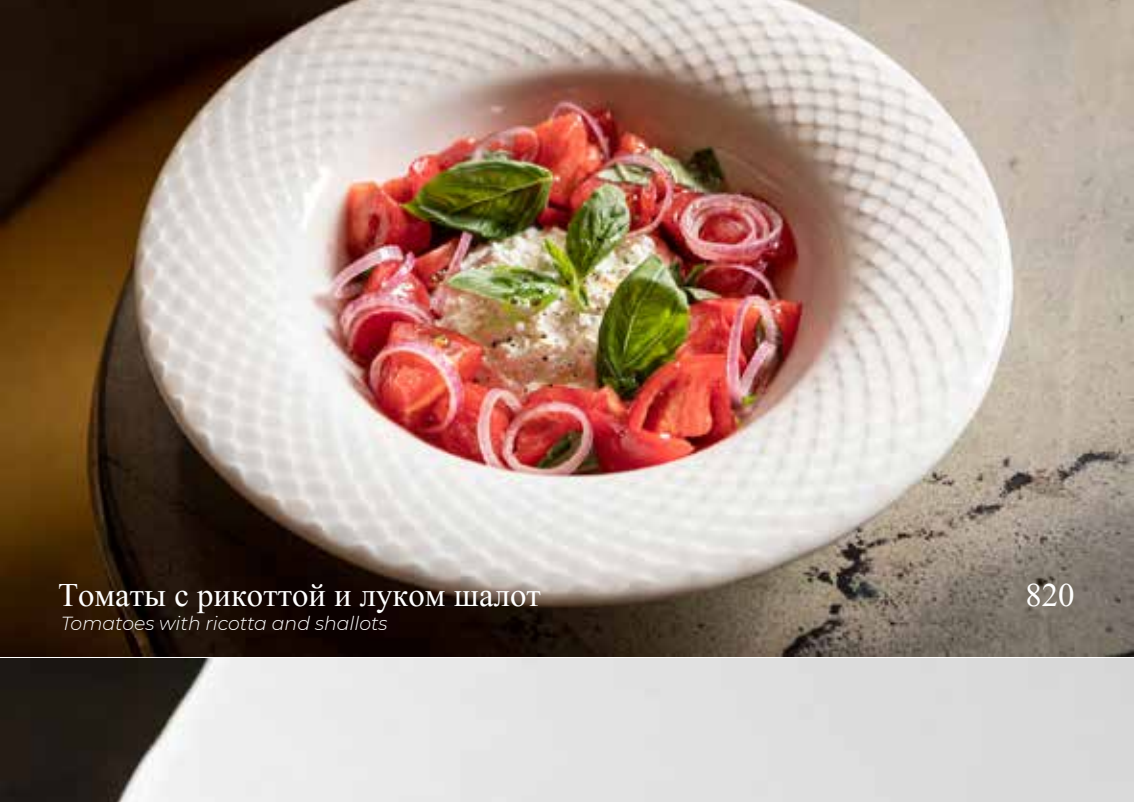
Томаты с рикоттой и луком шалот Tomatoes with ricotta and shallots