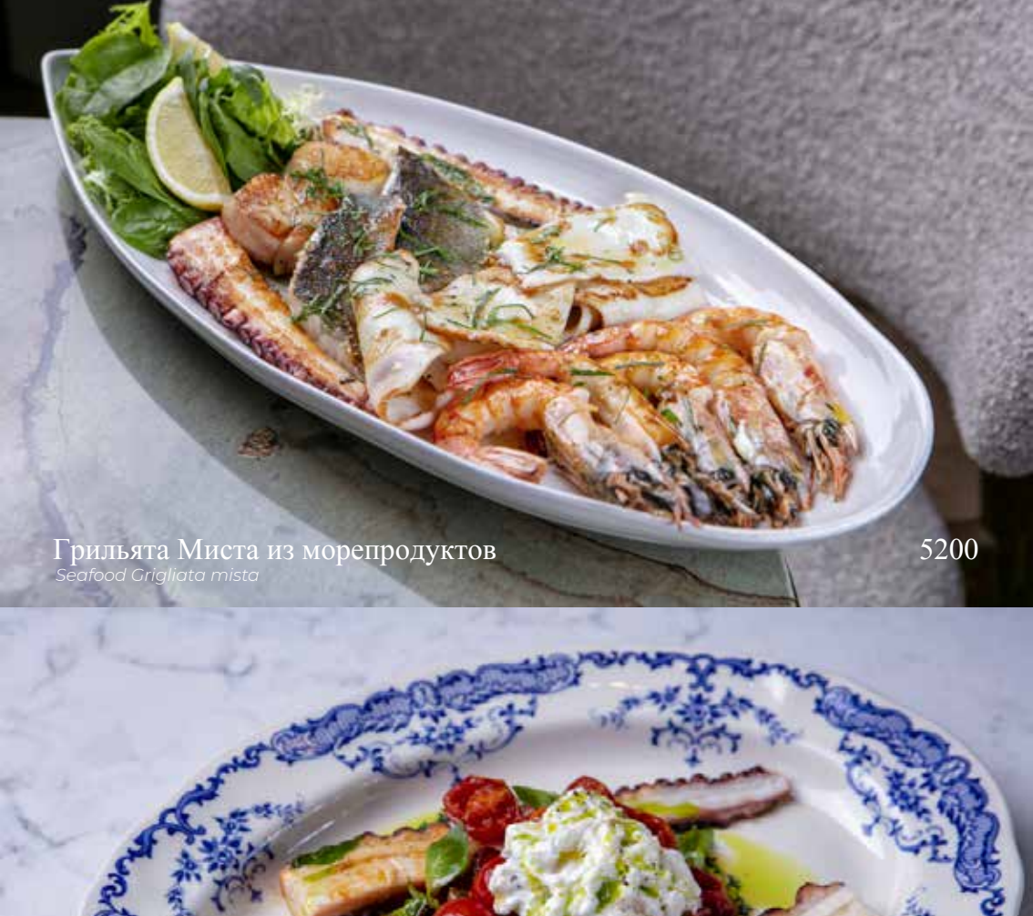
Грильята Миста из морепродуктов Seafood Grigliata mista