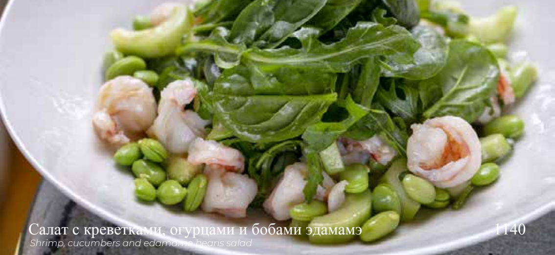
Салат с креветками, огурцами и бобами эдамаэ Shrimp, cucumbers and edamame beans salad