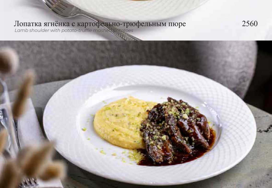
Лопатка ягнёнка с картофельно-трюфельным пюре Lamb shoulder with potato-truffle mashed potatoes