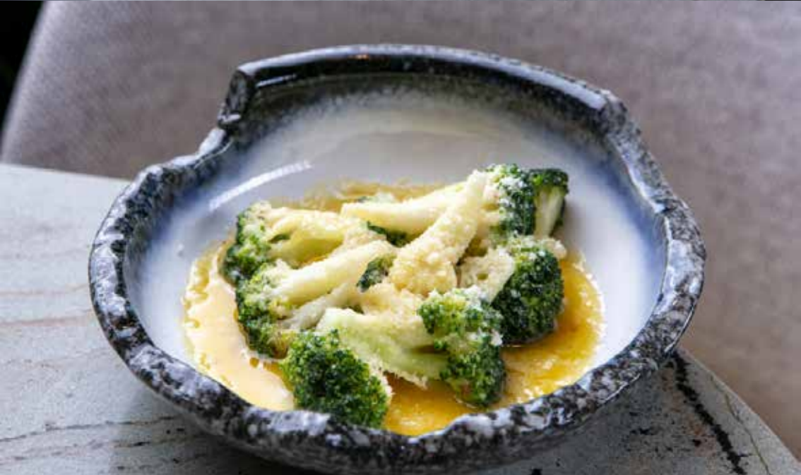
Брокколи с чесноком и пармезаном Garlic and parmesan broccoli