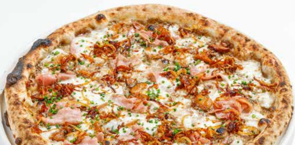
Пицца с белыми грибами и прошутто котто