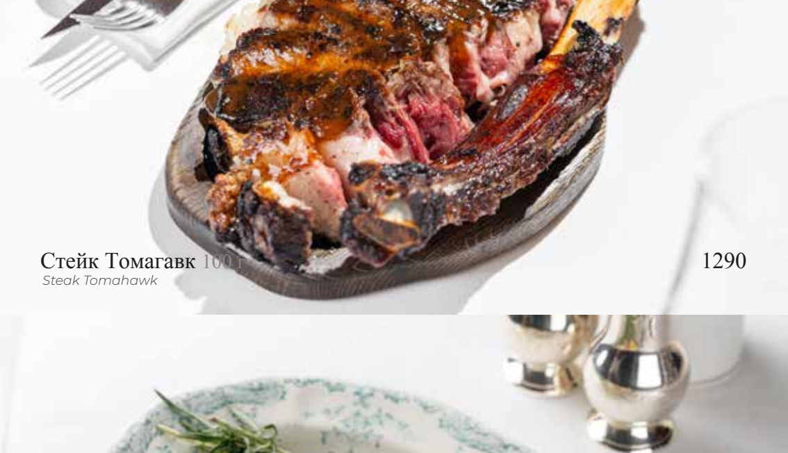
Стейк Томагавк 100 гр Steak Tomahawk