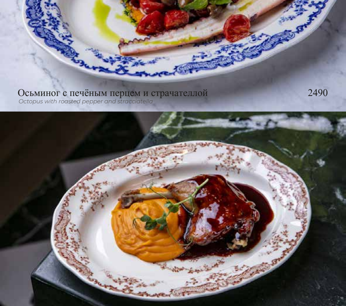
Осьминог с печёным перцем и страчателлой Octopus with roasted pepper and stracciatella