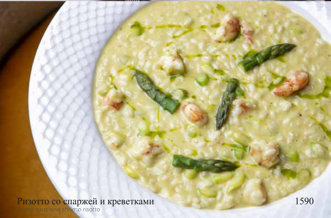
Ризотто со спаржей и креветками