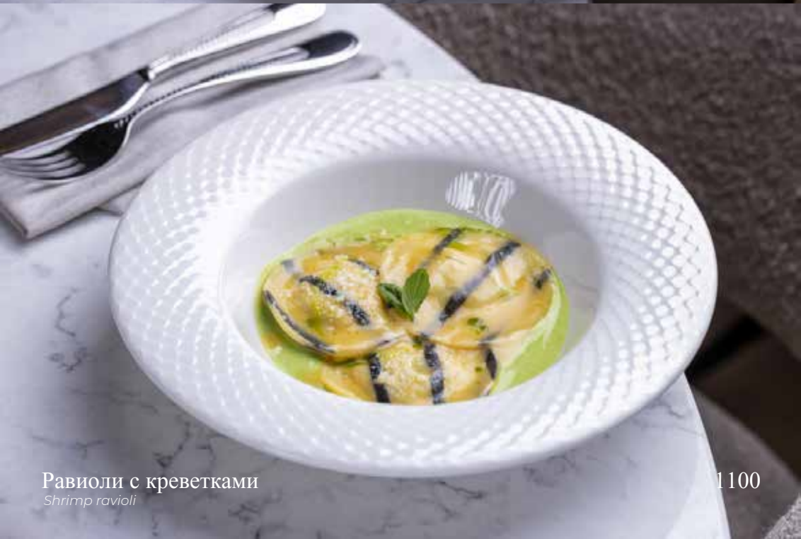
Равиоли с креветками