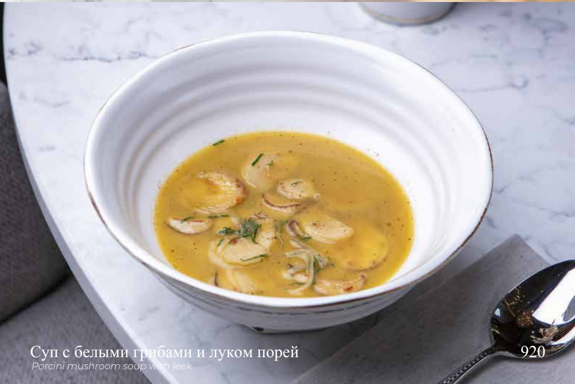
Суп с белыми грибами и луком порей Porcini mushroom soup with leek