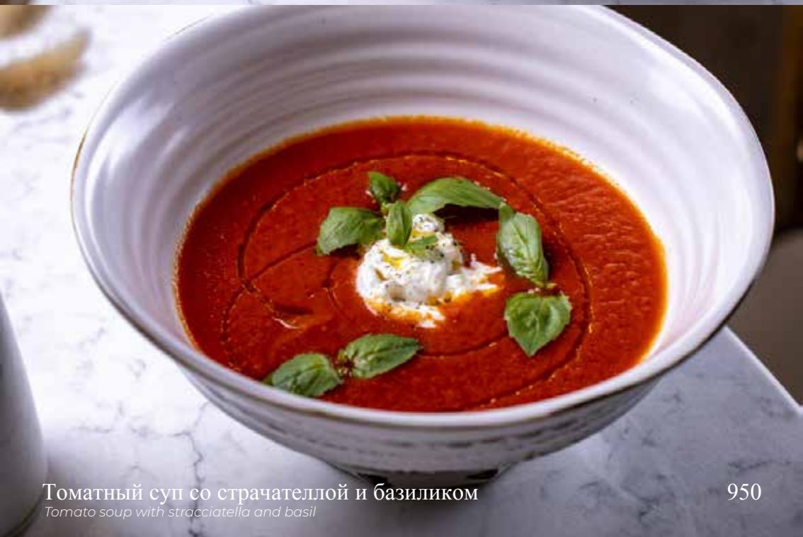
Томатный суп со страчателлой и базиликом Tomato soup with stracciatella and basil