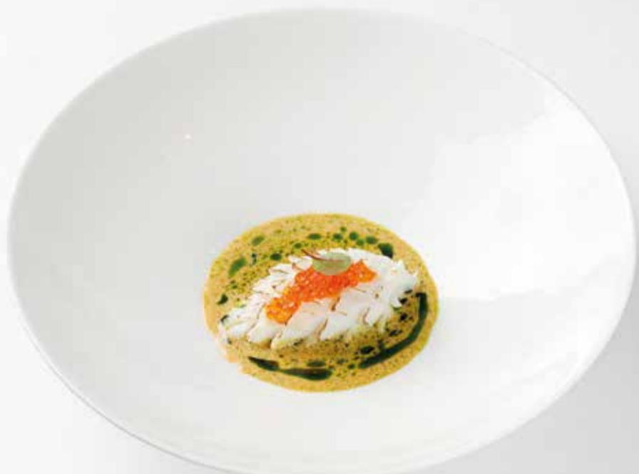
Фаршированный кальмар с лангустинами Stuffed calamar with langoustines