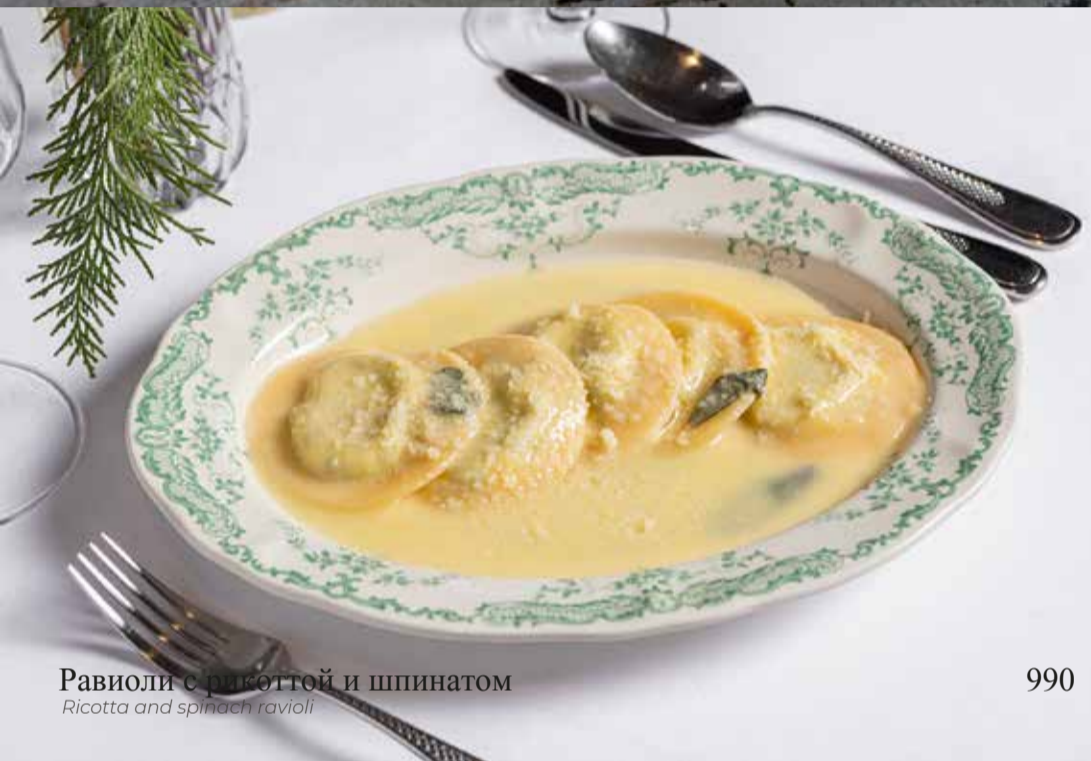
Равиоли с рикоттой и шпинатом