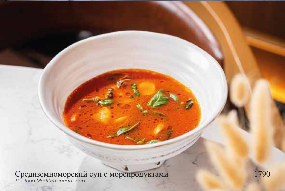
Средиземноморский суп с морепродуктами Seafood Mediterranean soup