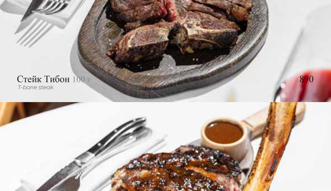
Стейк Тибон 100 гр T-bone steak