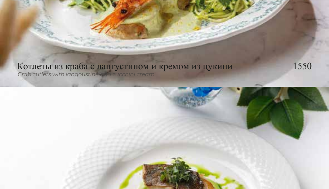
Чёрная треска с пюре из зелёного горошка Black cod with green pea puree