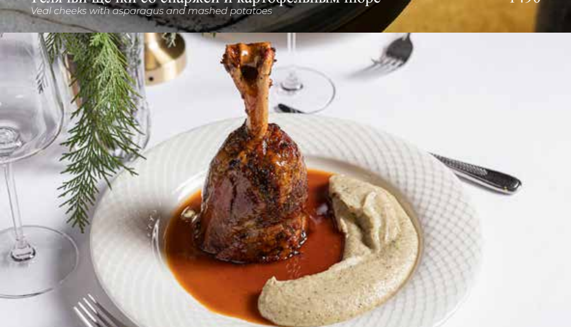
Телячьи щёчки со спаржей и картофельным пюре Veal cheeks with asparagus and mashed potatoes