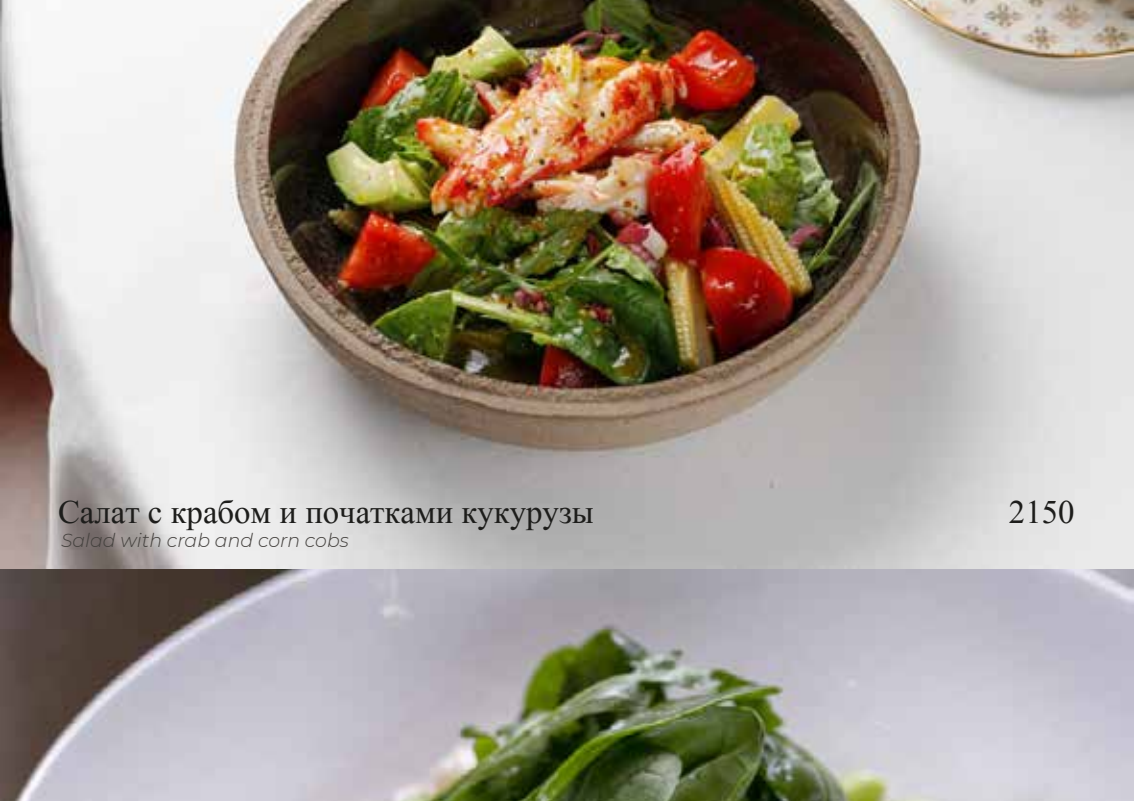
Салат с крабом и початками кукурузы Salad with crab and corn cobs