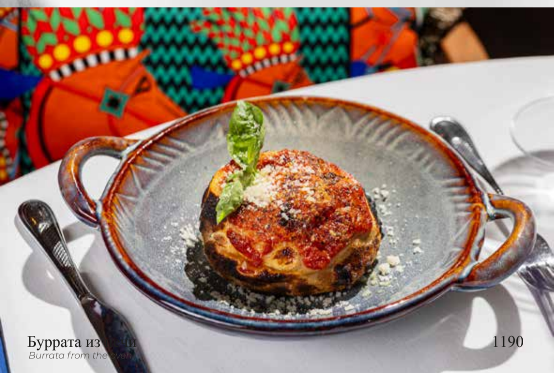
Буррата из печи Burrata from the oven