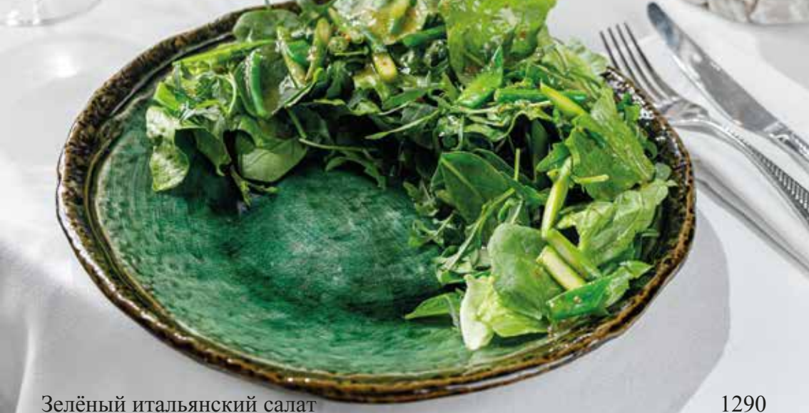
Зелёный итальянский салат Italian green salad