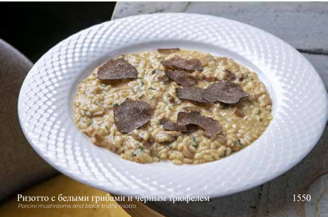
Ризотто с белыми грибами и чёрным трюфелем

Porcini mushrooms and black truffle risotto