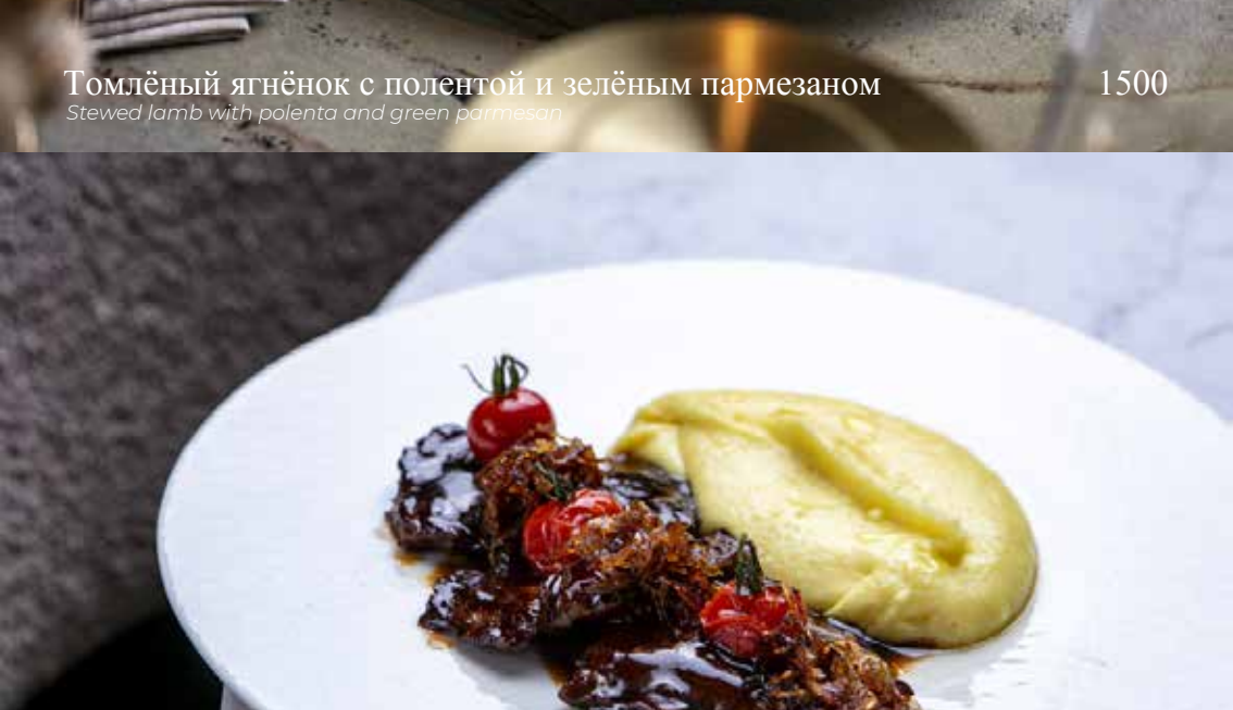
Томлёный ягнёнок с полентой и зелёным пармезаном Stewed lamb with polenta and green parmesan