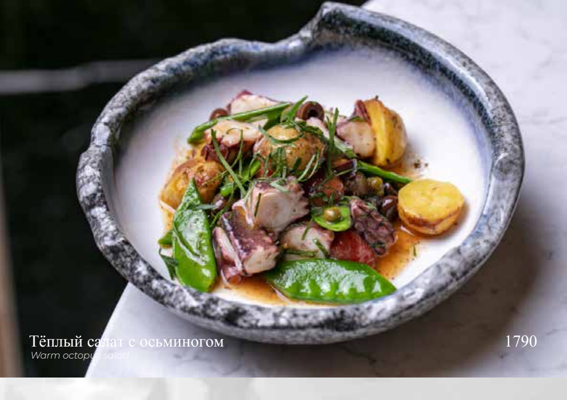
Тёплый салат с осьминогом Warm octopus salad