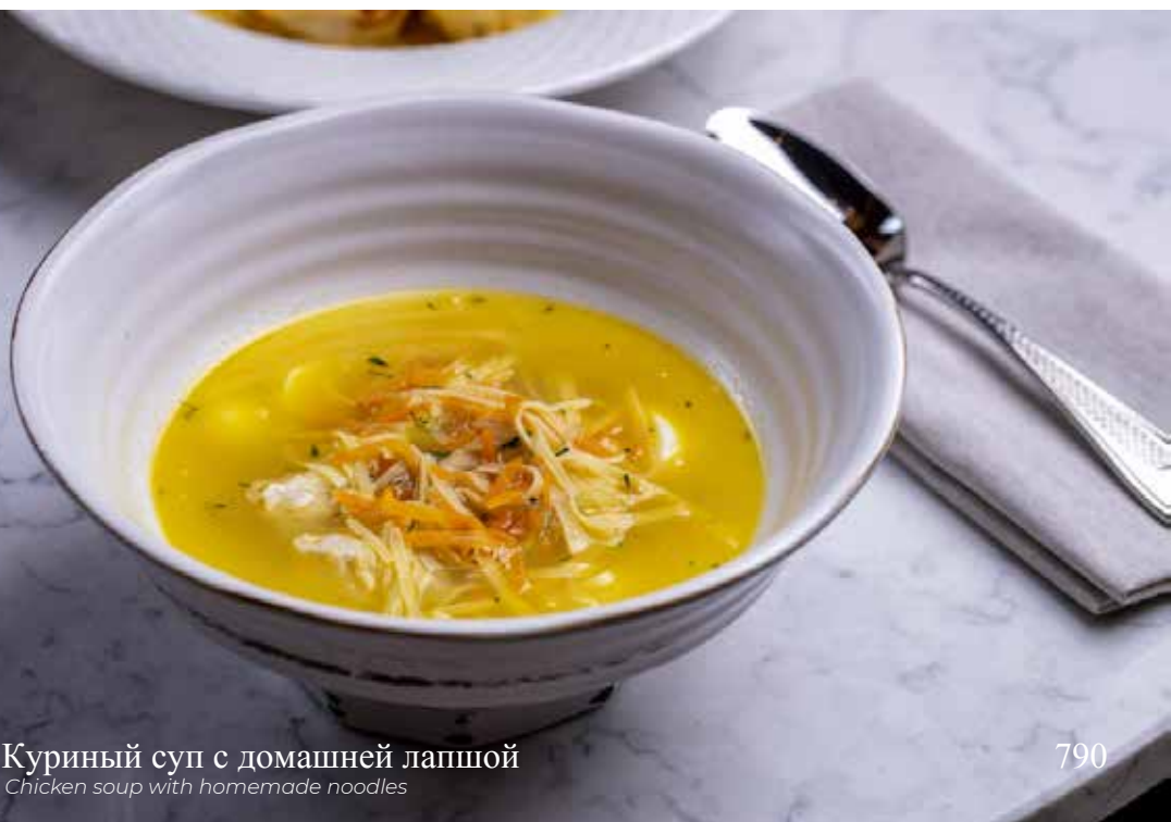
Куриный суп с домашней лапшой Chicken soup with homemade noodles