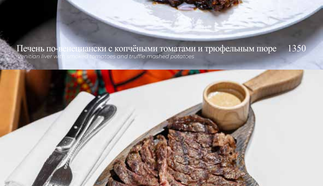
Печень по-венециански с копчёными томатами и трюфельным пюре Venetian liver with smoked tomatoes and truffle mashed potatoes