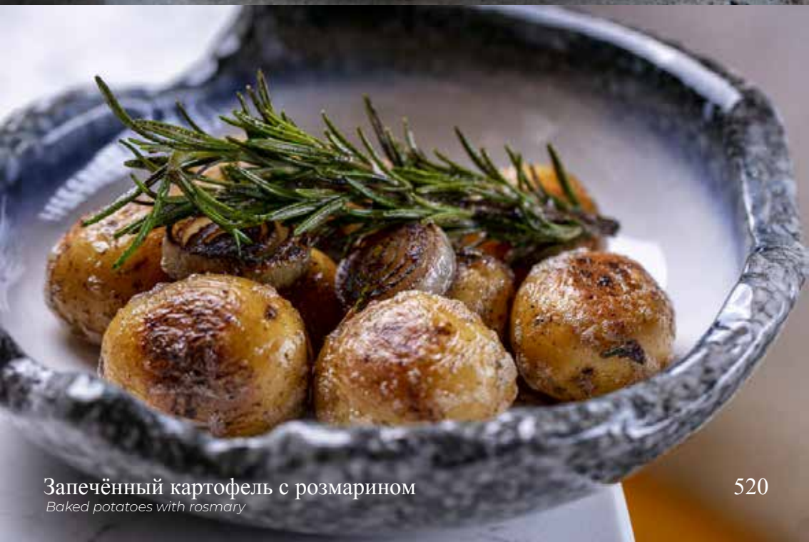
Запечённый картофель с розмарином Baked potatoes with rosemary