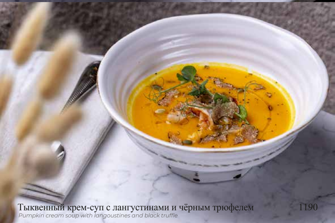
Тыквенный крем-суп с лангустинами и чёрным трюфелем Pumpkin cream soup with langoustines and black truffle