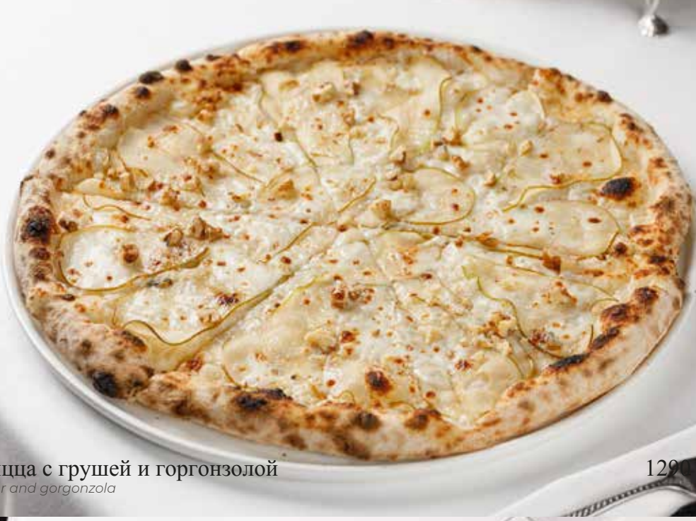
Пицца с грушей и горгонзолы