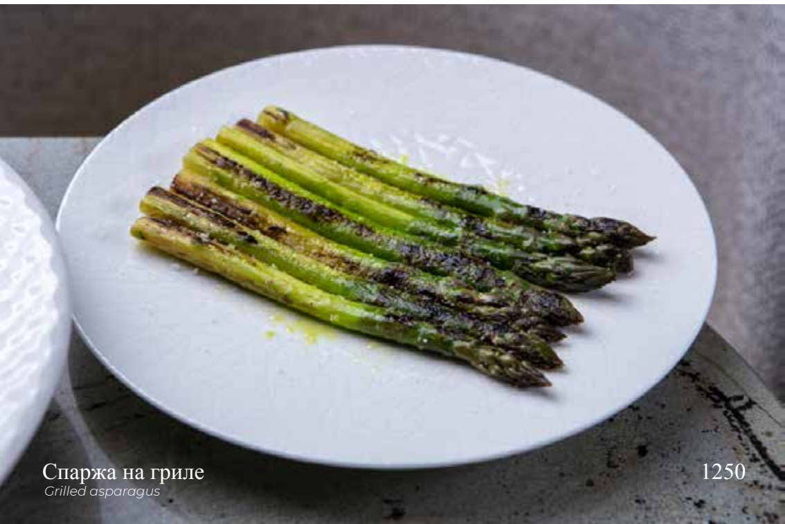
Спаржа на гриле Grilled asparagus