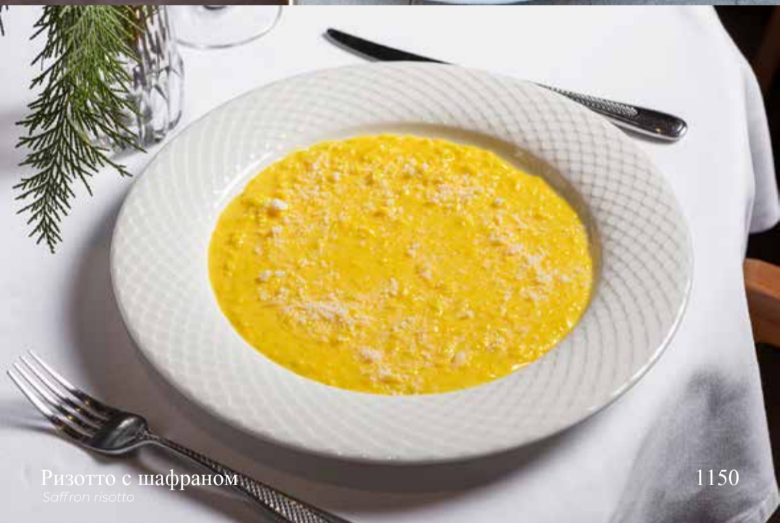
Ризотто с шафраном