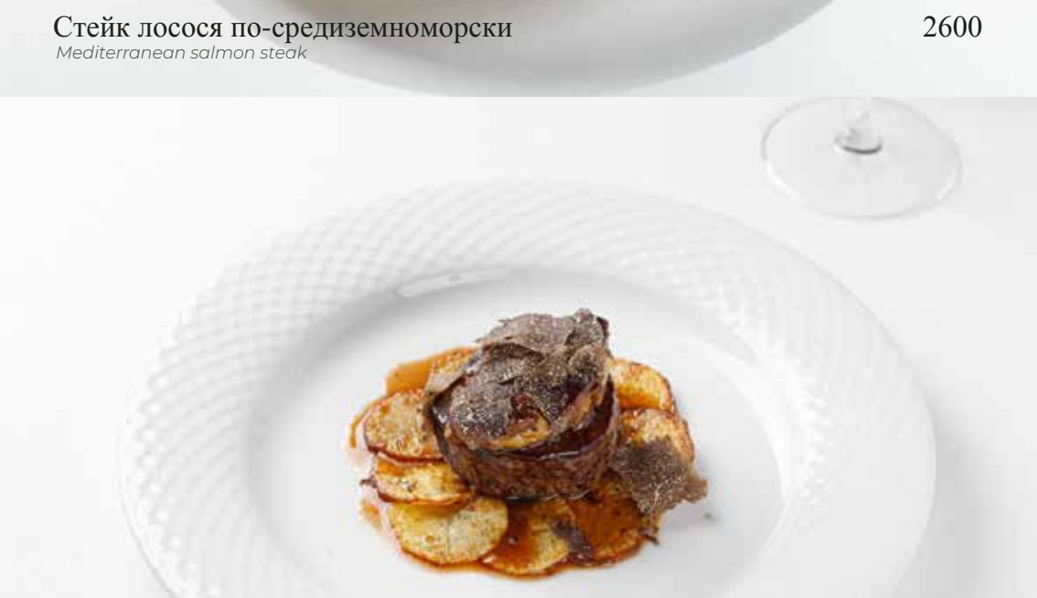
Турнедо Россини Tournedo Rossini