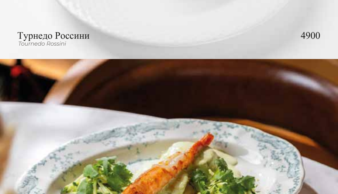
Котлеты из краба с langoustine и кремом из цуккини Crab cutlets with langoustine and zucchini cream