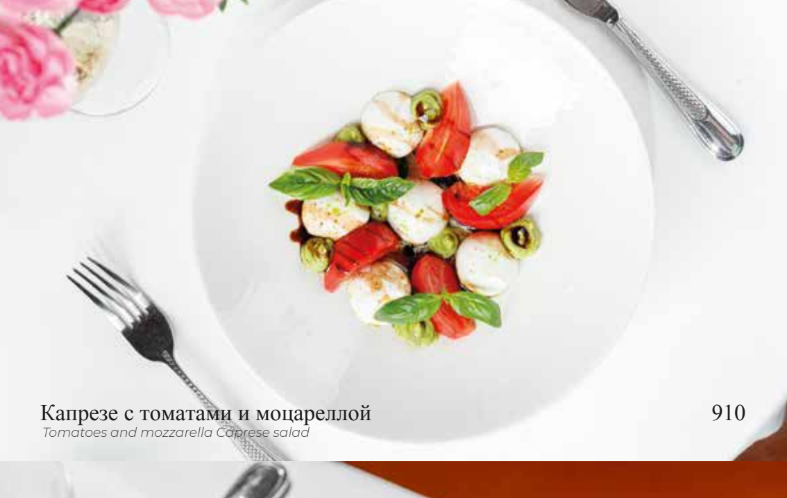
Капрезе с томатами и моцареллой Tomatoes and mozzarella Caprese salad