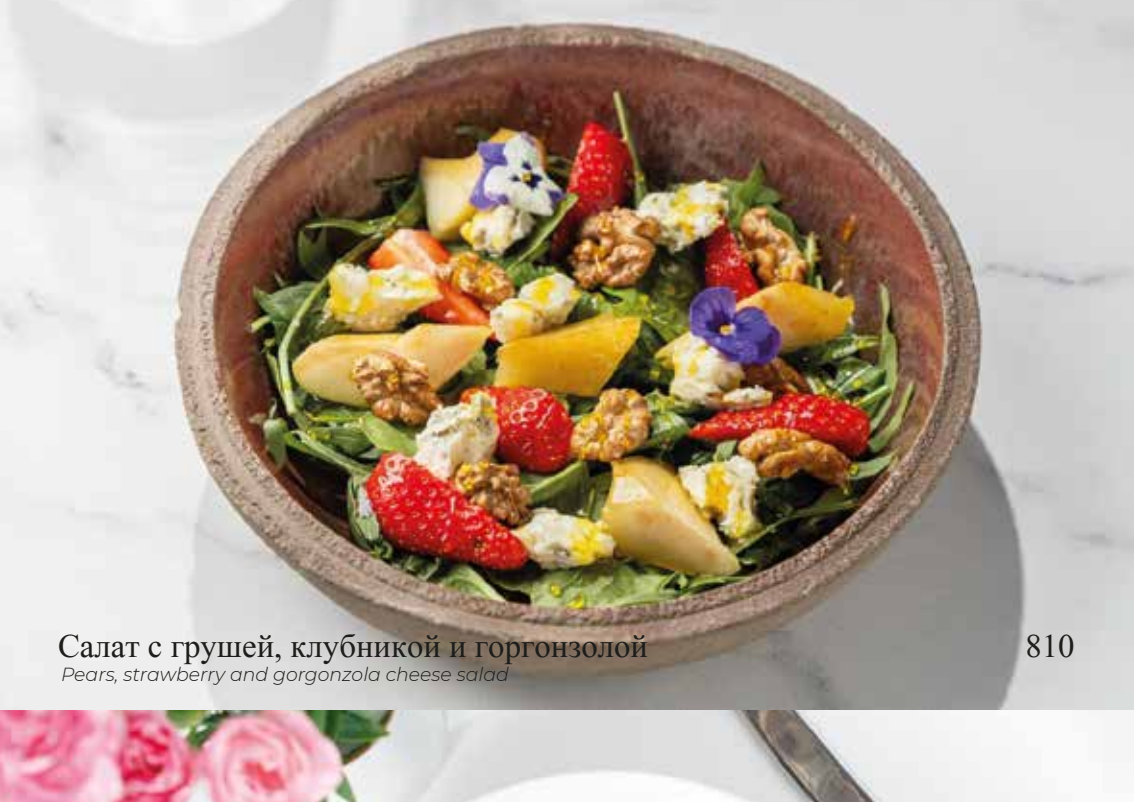
Салат с грушей, клубникой и горгонзоллой Pears, strawberry and gorgonzola cheese salad