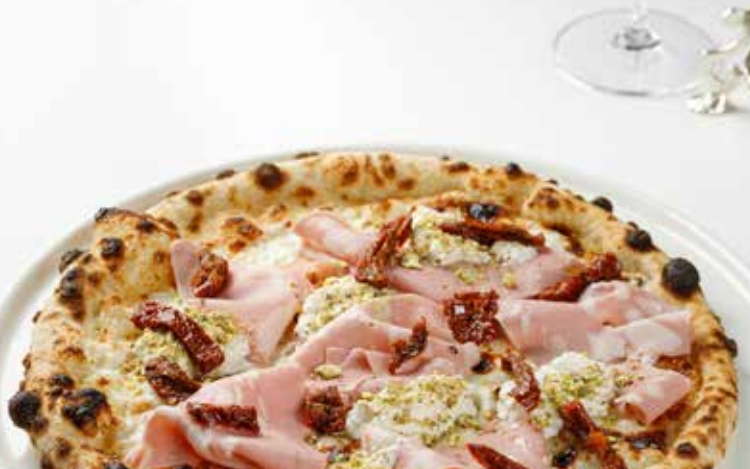
Пицца с морделлой, страчателлой и фисташками

Pizza with mortadella stracciatella and pistachios