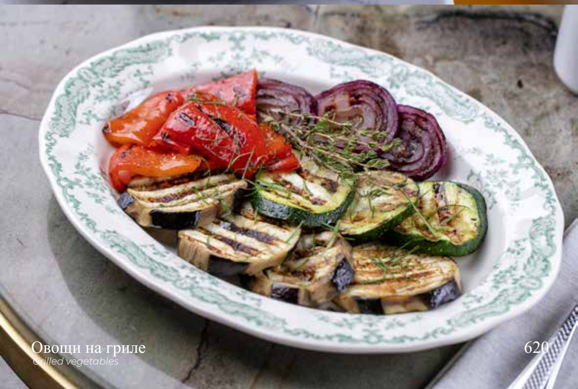
Овощи на гриле Grilled vegetables