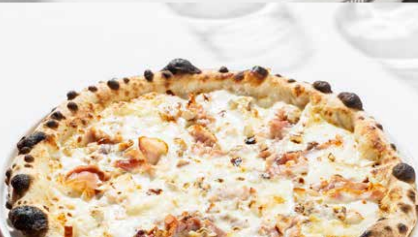
Пицца спек и бри