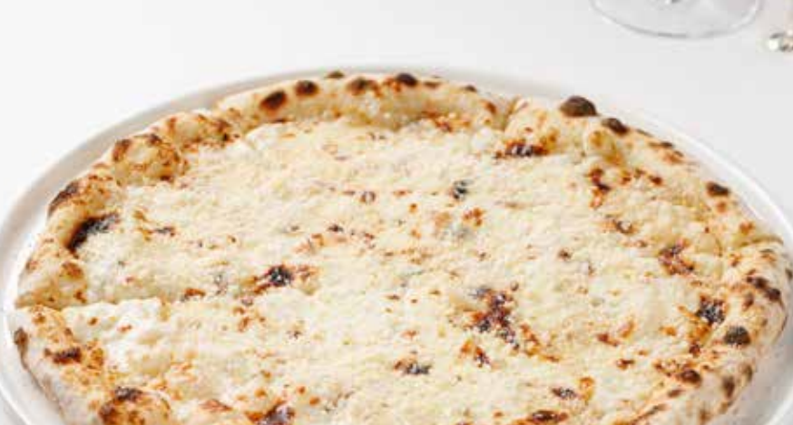
Пицца 4 сыра