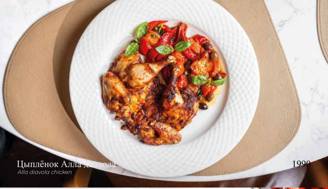
Цыплёнок Алла дьявола Alla diavola chicken