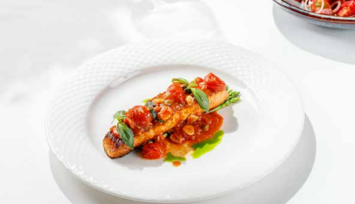
Стейк лосося по-средиземноморски Mediterranean salmon steak