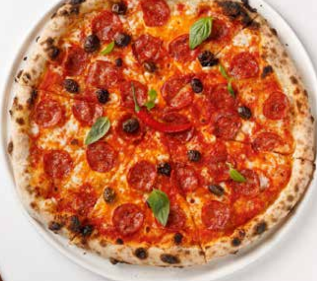
Пицца Алла диавола