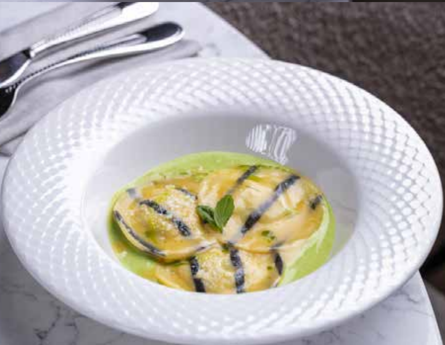
Равиоли с креветками