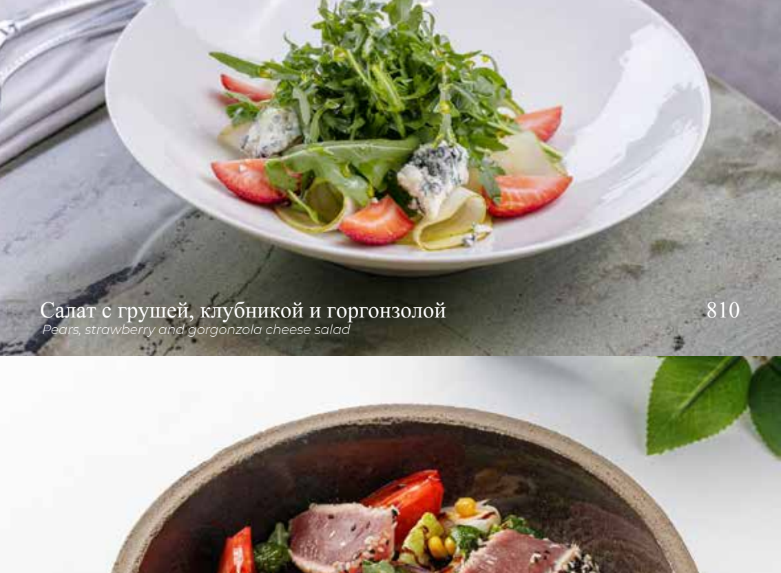
Салат с грушей, клубникой и горгонзолой

Pears, strawberry and gorgonzola cheese salad