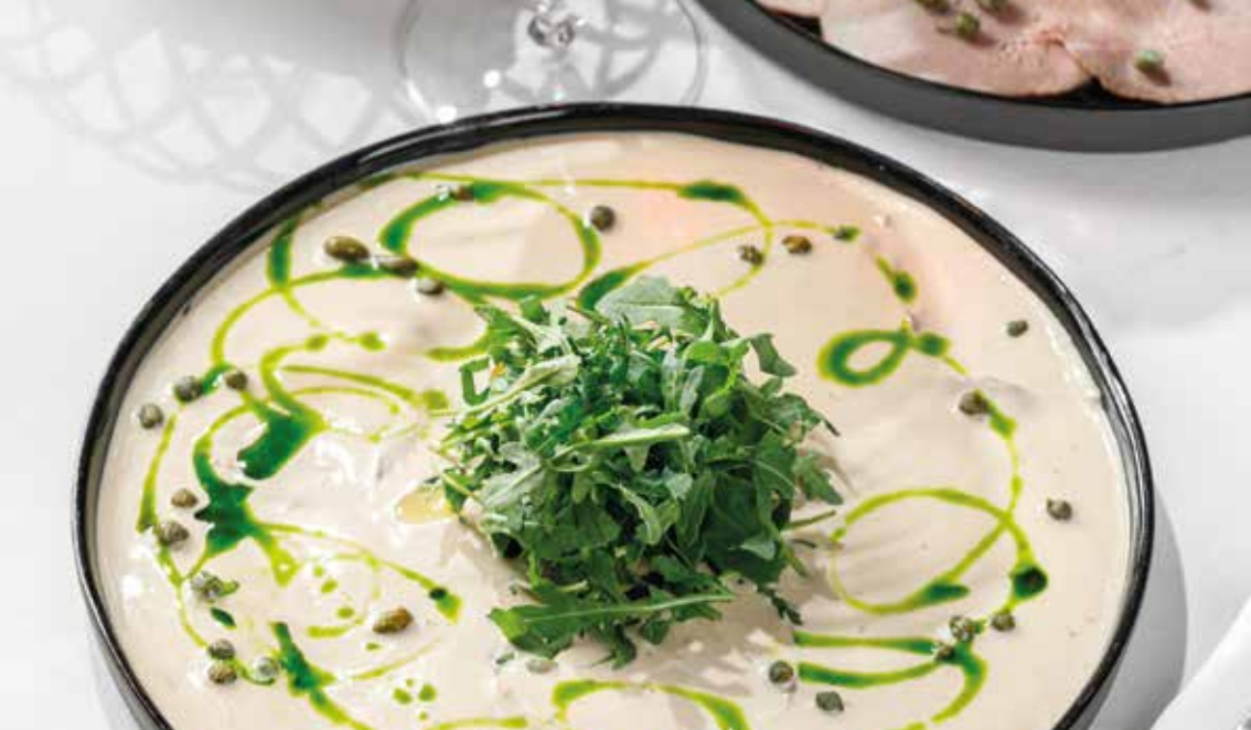
Вителло Тоннато с руколой и каперсами Vitello Tonnato with arugula and caperberries