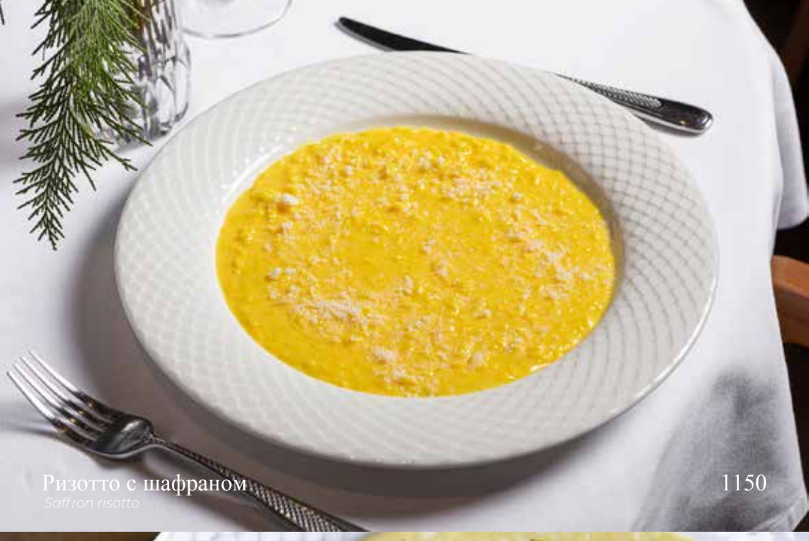
Ризотто с шафраном Saffron risotto