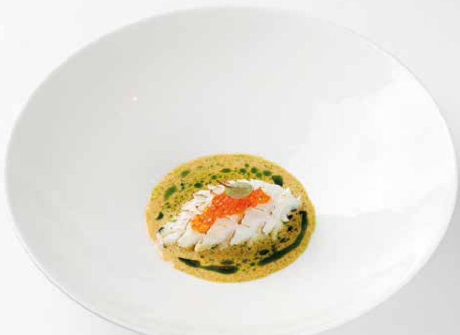
Фаршированный кальмар с лангустинами Stuffed calamar with langoustines