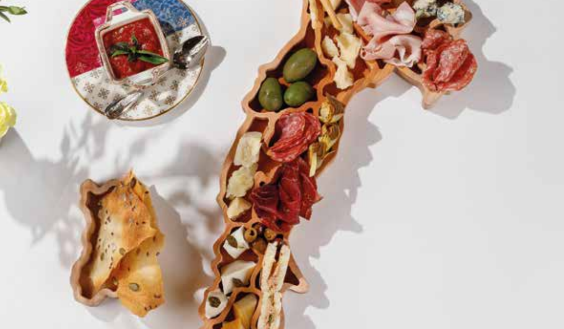
Ассорти итальянских колбас Assorted Italian sausages