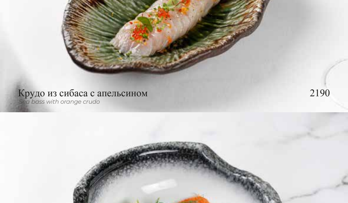
Крудо из сибаса с апельсином Sea bass with orange crudo