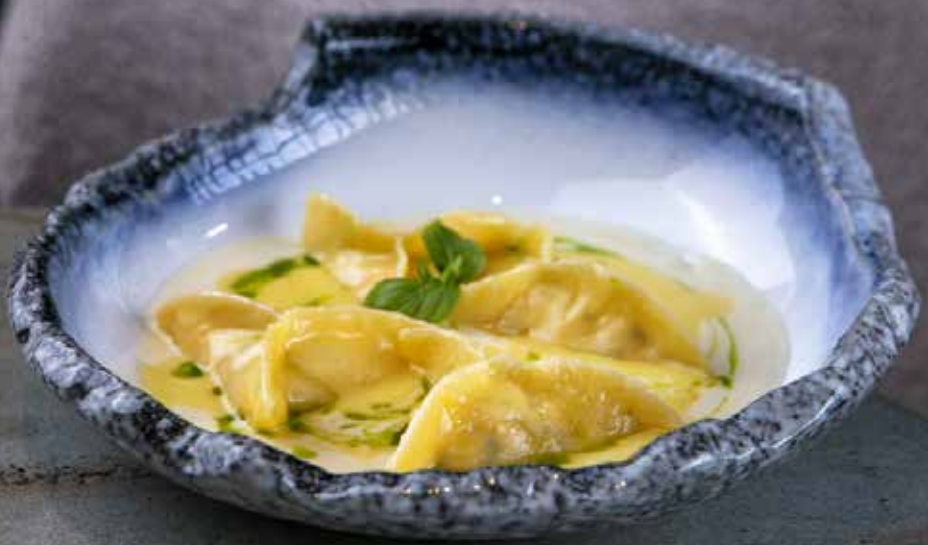
Равиоли с крабом