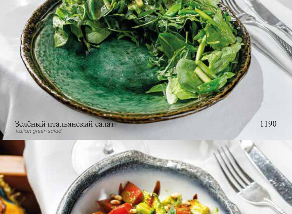
Зелёный итальянский салат