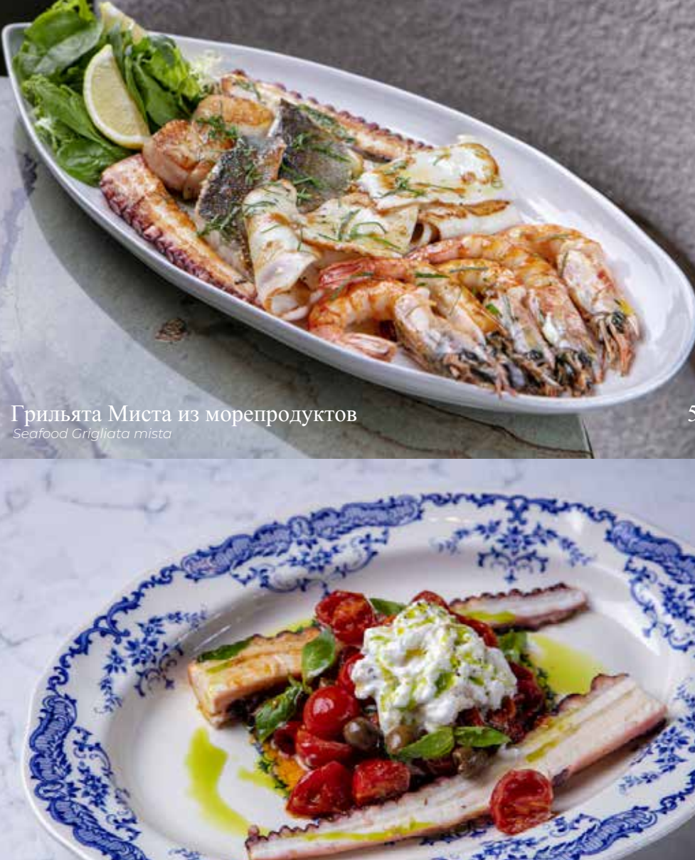
Грильята Миста из морепродуктов Seafood Grigliata mista