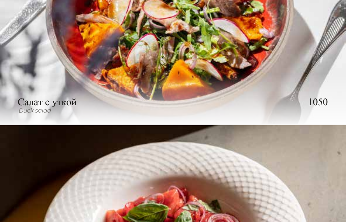
Салат с уткой