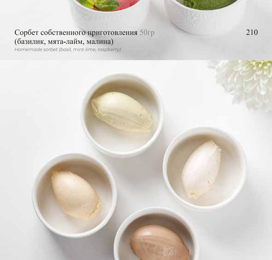
Мороженое Джелато 50гр