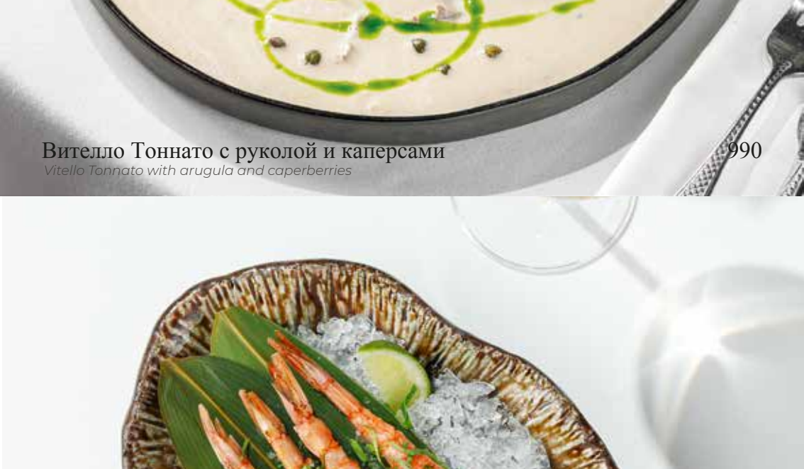
Крудо из красной креветки Red shrimp crudo