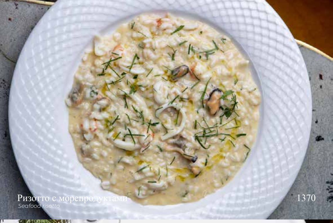
Ризотто с морепродуктами Seafood risotto