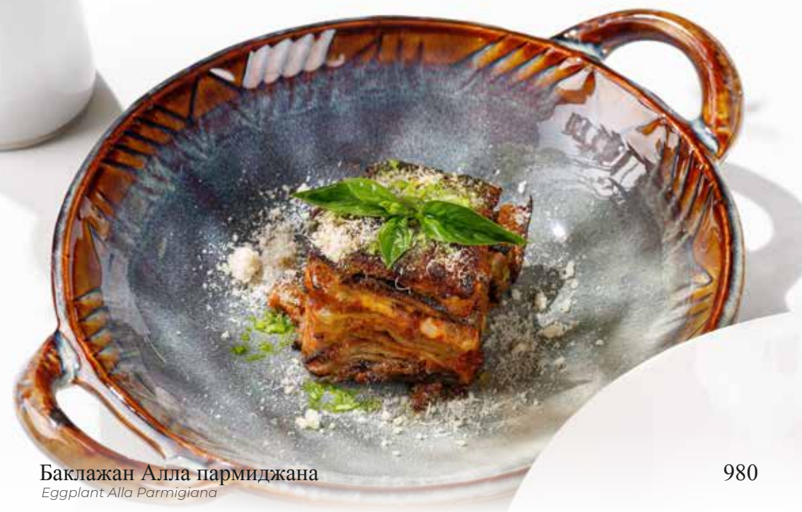
Баклажан Алла пармиджана Eggplant Alla Parmigiana