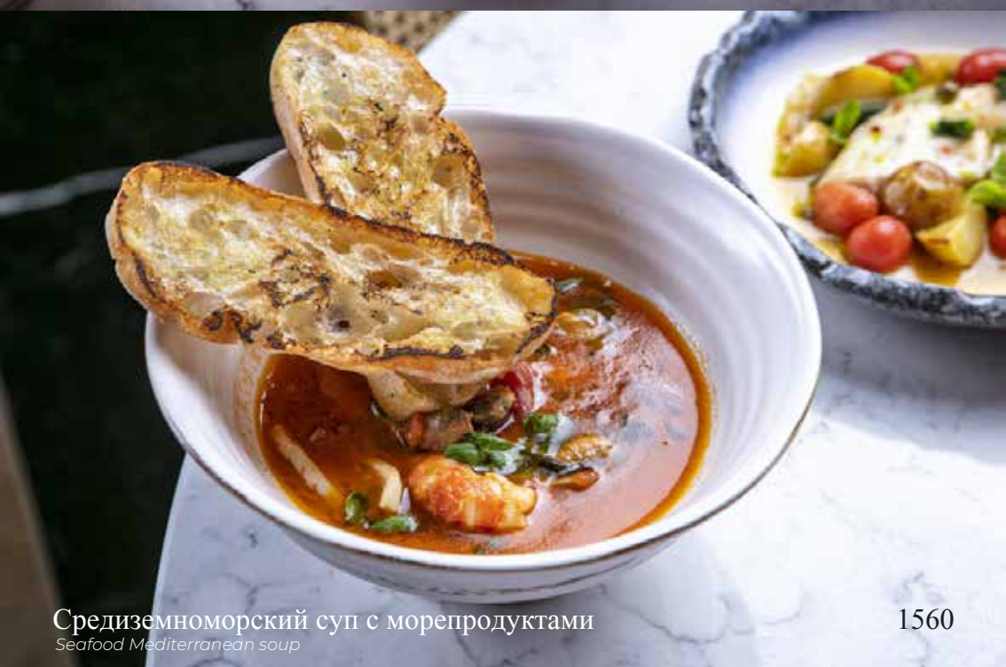
Средиземноморский суп с морепродуктами Seafood Mediterranean soup