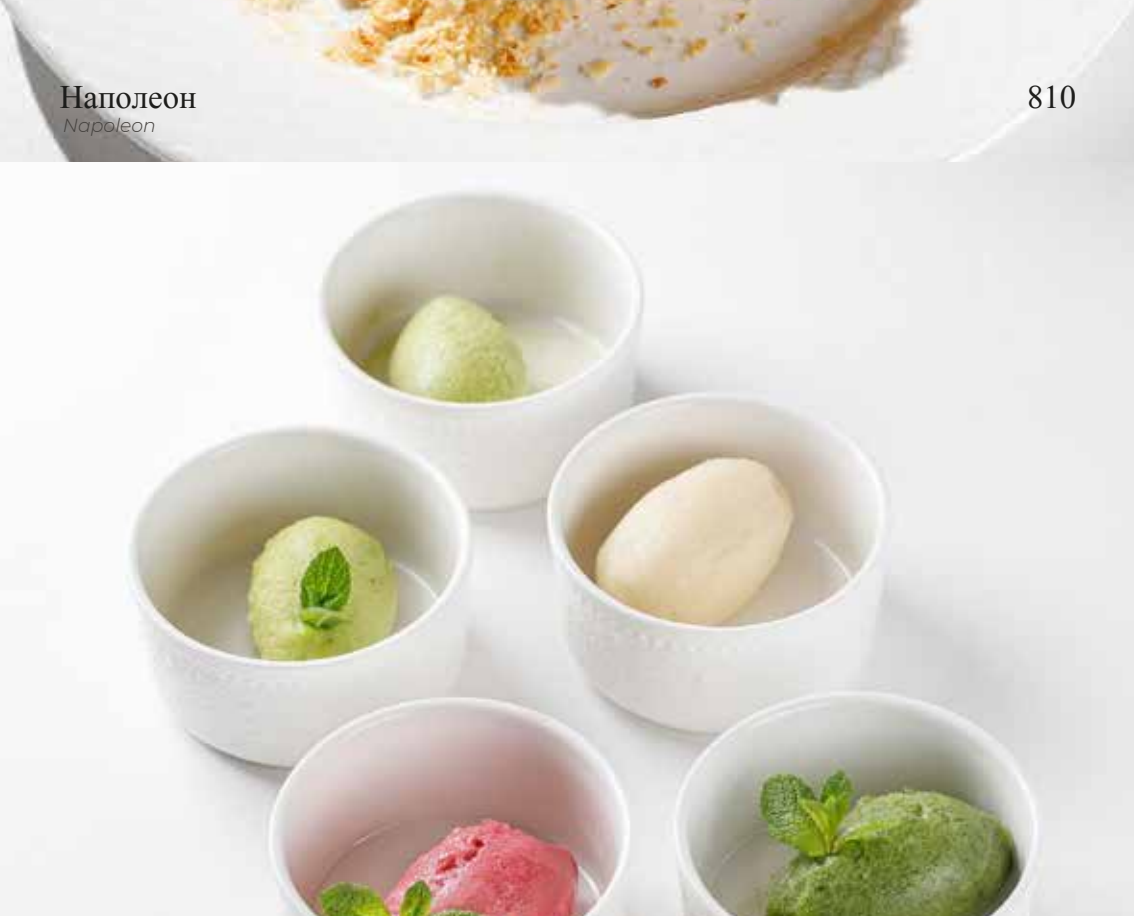
Сорбет собственного приготовления 50гр