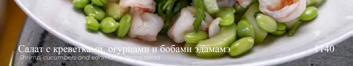
Салат с креветками, огурцами и бобами эдамамэ

Shrimp, cucumbers and edamame beans salad