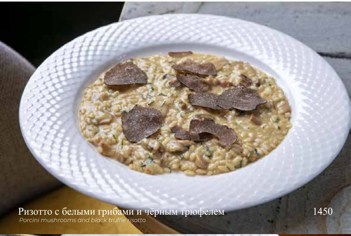
Ризотто с белыми грибами и чёрным трюфелем Porcini mushrooms and black truffle risotto