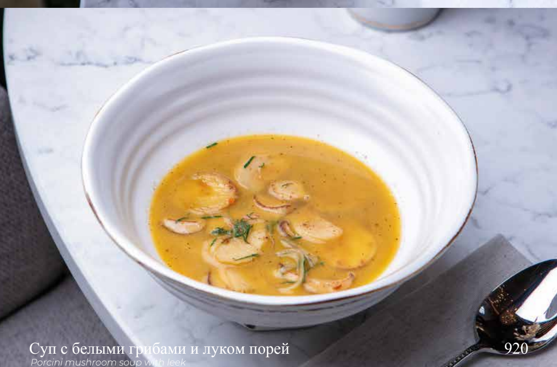
Суп с белыми грибами и луком порей Porcini mushroom soup with leek