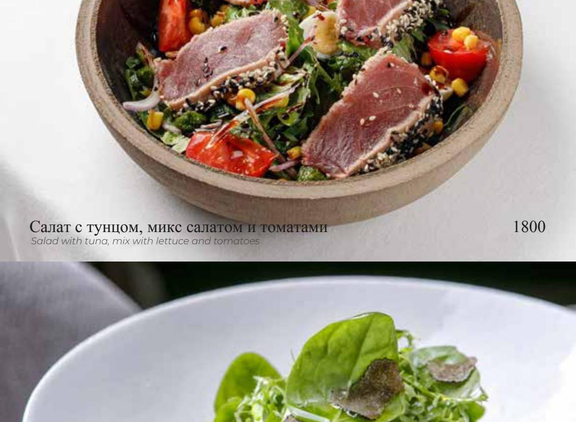
Салат с тунцом, микс салатом и томатами

Salad with tuna, mix with lettuce and tomatoes