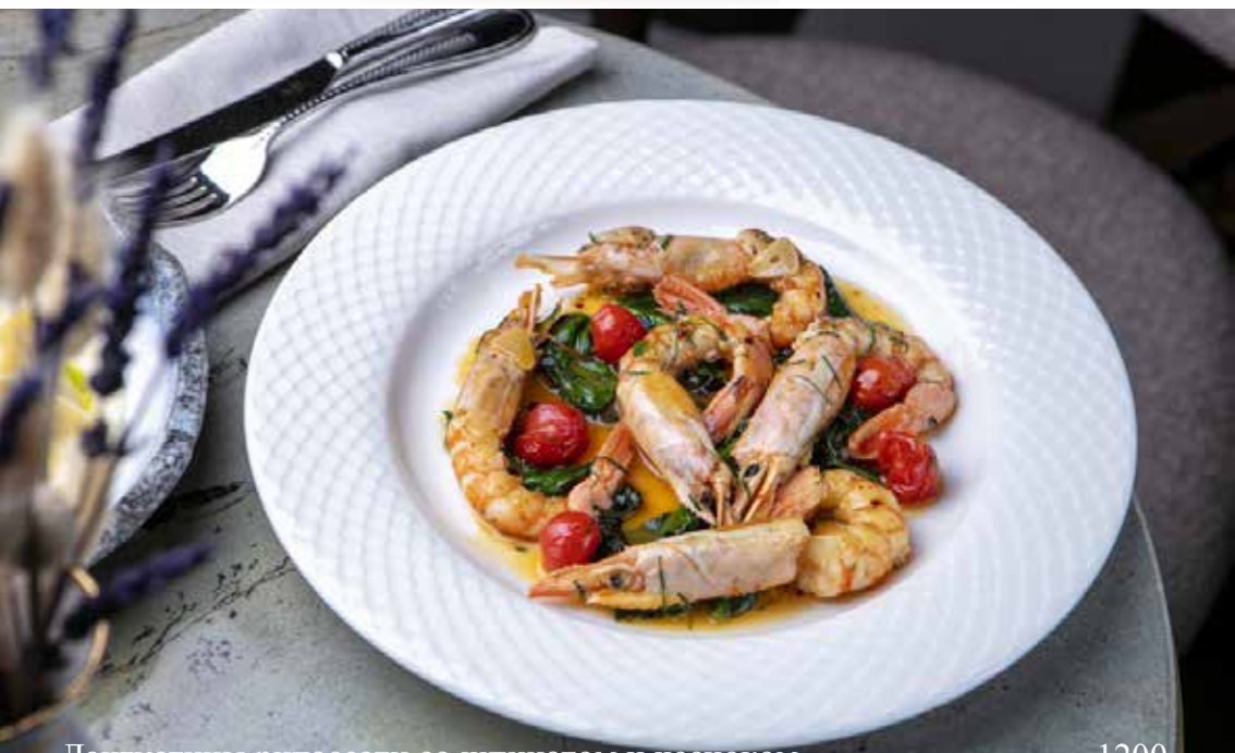
Лангустины рипассати со шпинатом и чесноком Ripassati langoustines with spinach and garlic