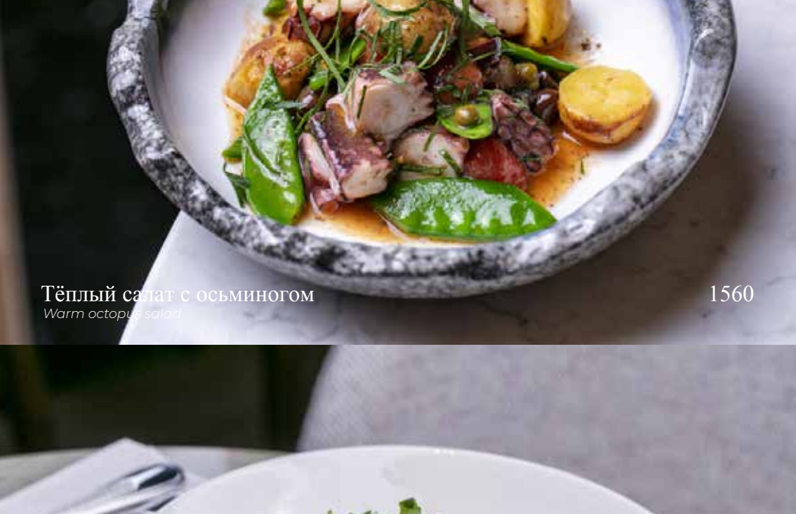
Тёплый салат с осьминогом