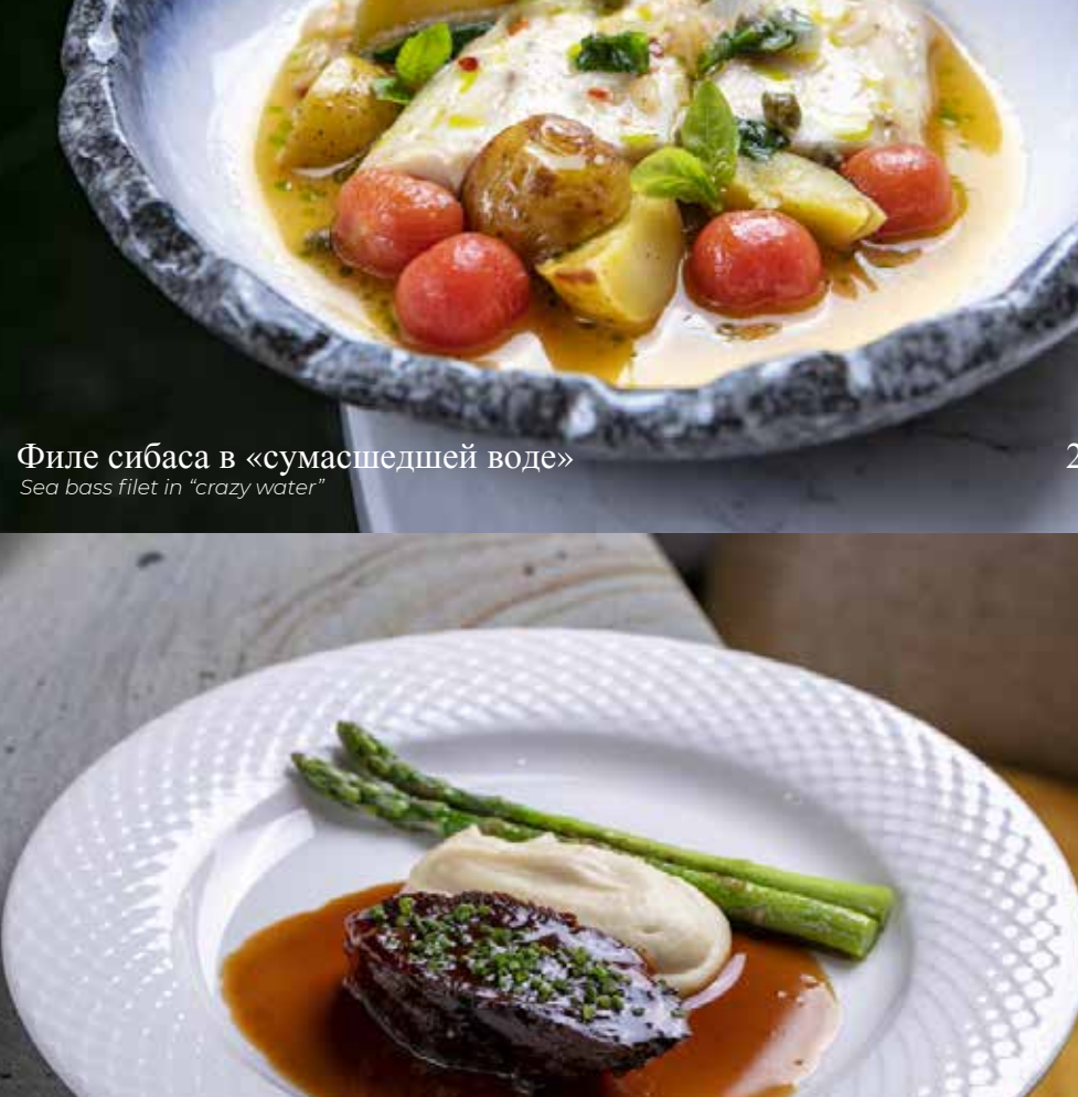
Утиная ножка конфи под соусом Апельсиновый порто Confit duck leg in Orange porto sauce