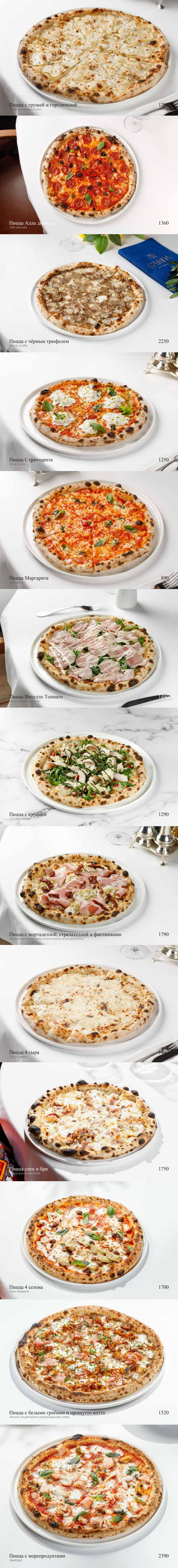
Пицца с грушей и горгонзолой