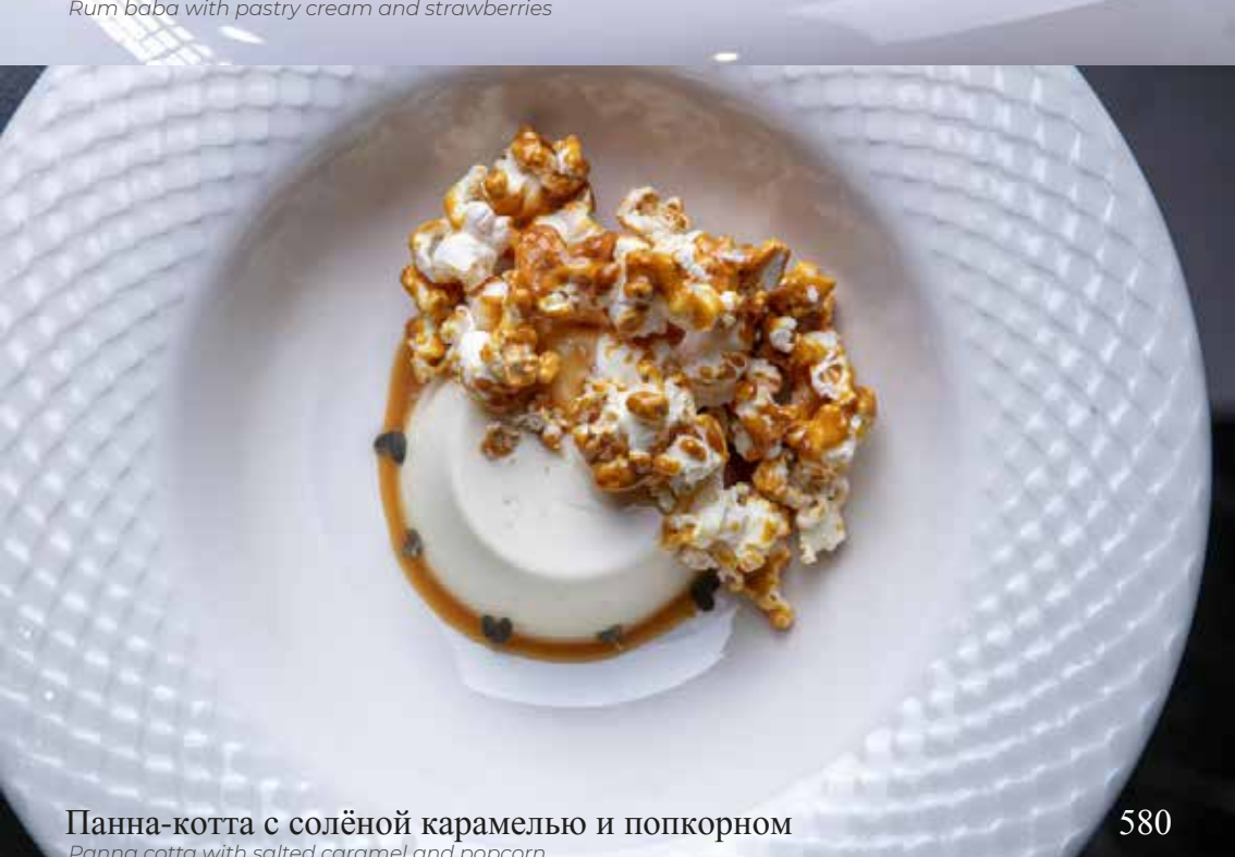
Панна-котта с солёной карамелью и попкорном

Panna cotta with salted caramel and popcorn