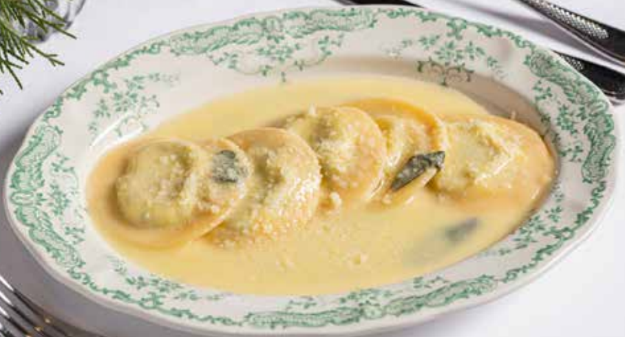
Равиоли с рикоттой и шпинатом