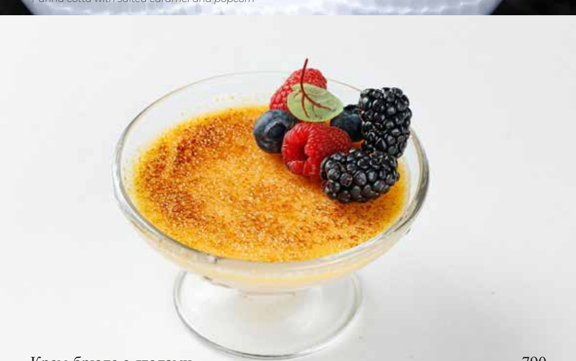
Крем-брюле с ягодами