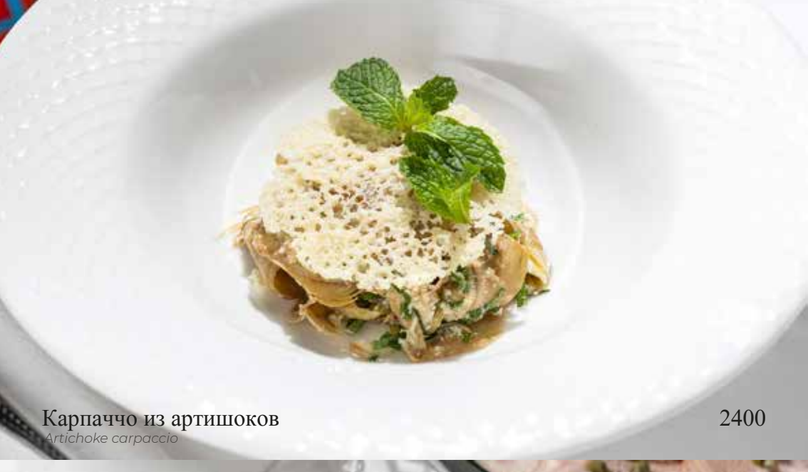
Карпаччо из артишоков Artichoke carpaccio