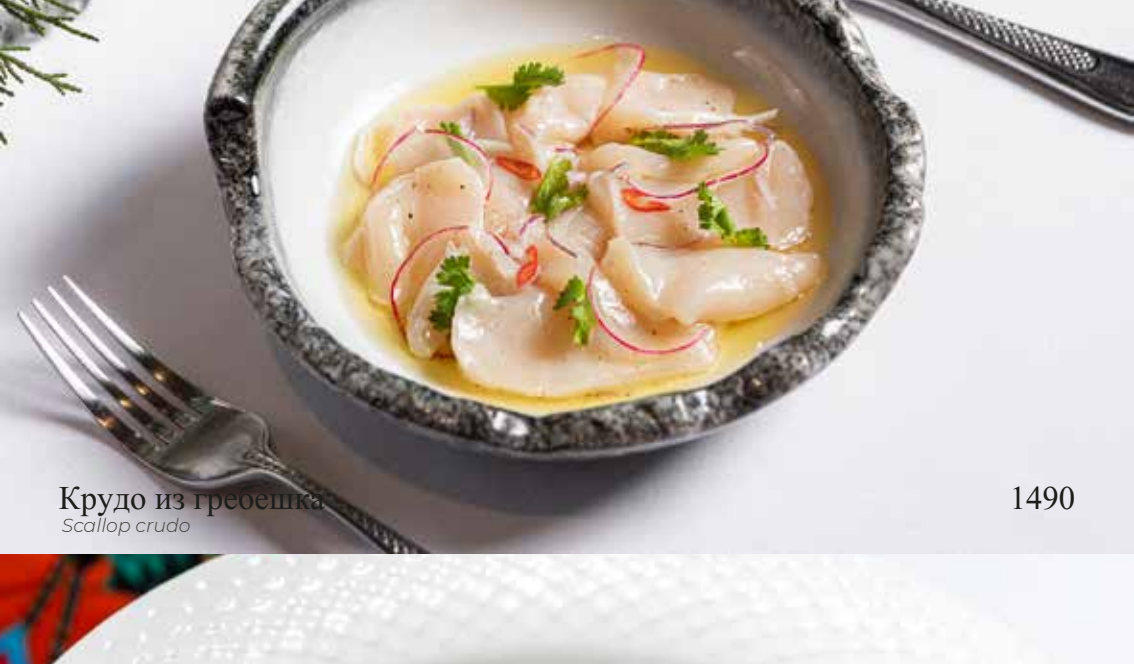
Крудо из гребешка Scallop crudo