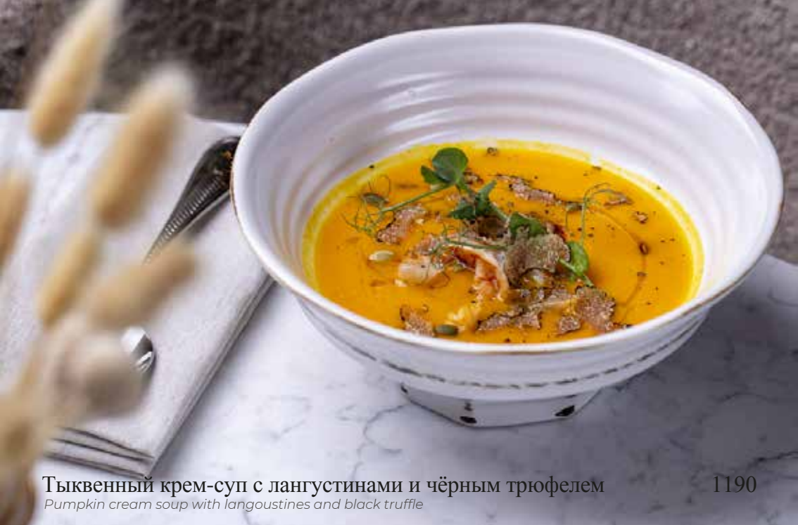
Тыквенный крем-суп с langoustинами и чёрным трюфелем Pumpkin cream soup with langoustines and black truffle