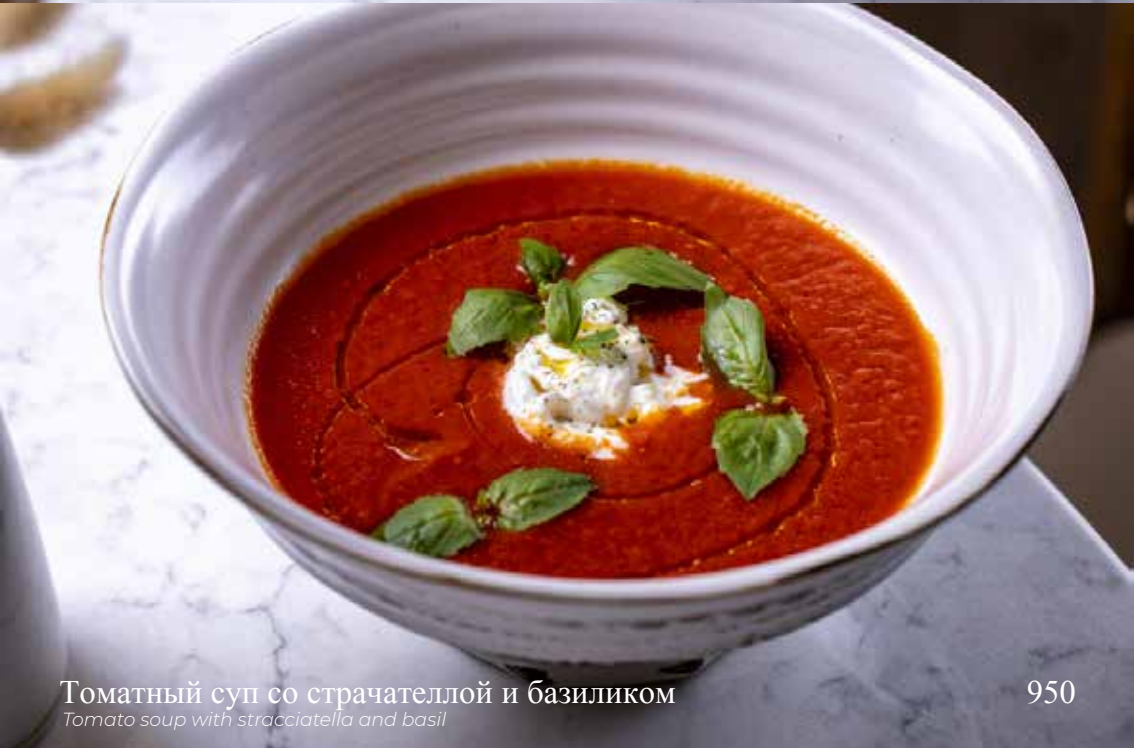
Томатный суп со страчателлой и базиликом Tomato soup with stracciatella and basil