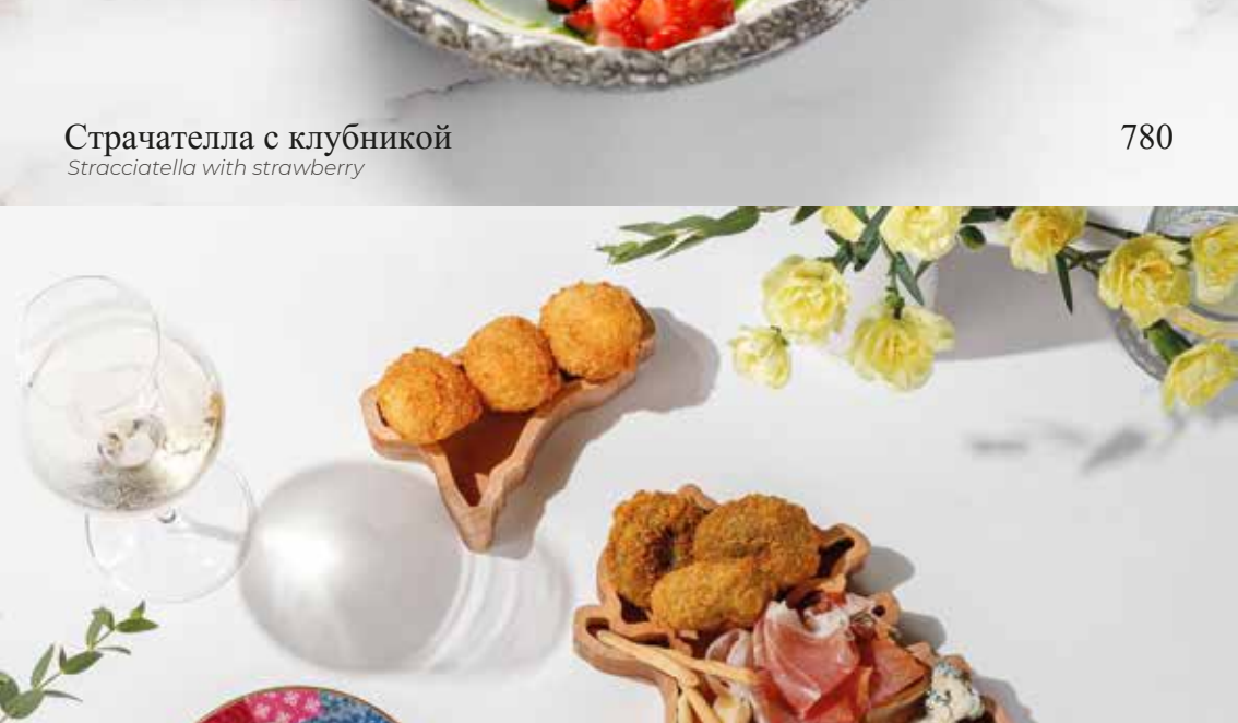
Ассорти итальянских сыров Assorted Italian cheeses