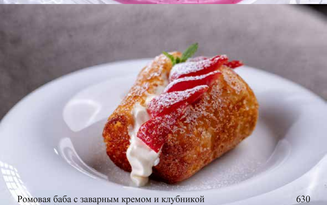
Ромовая баба с заварным кремом и клубникой

Rum baba with pastry cream and strawberries