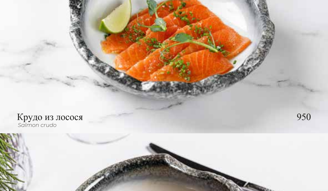
Крудо из лосося Salmon crudo