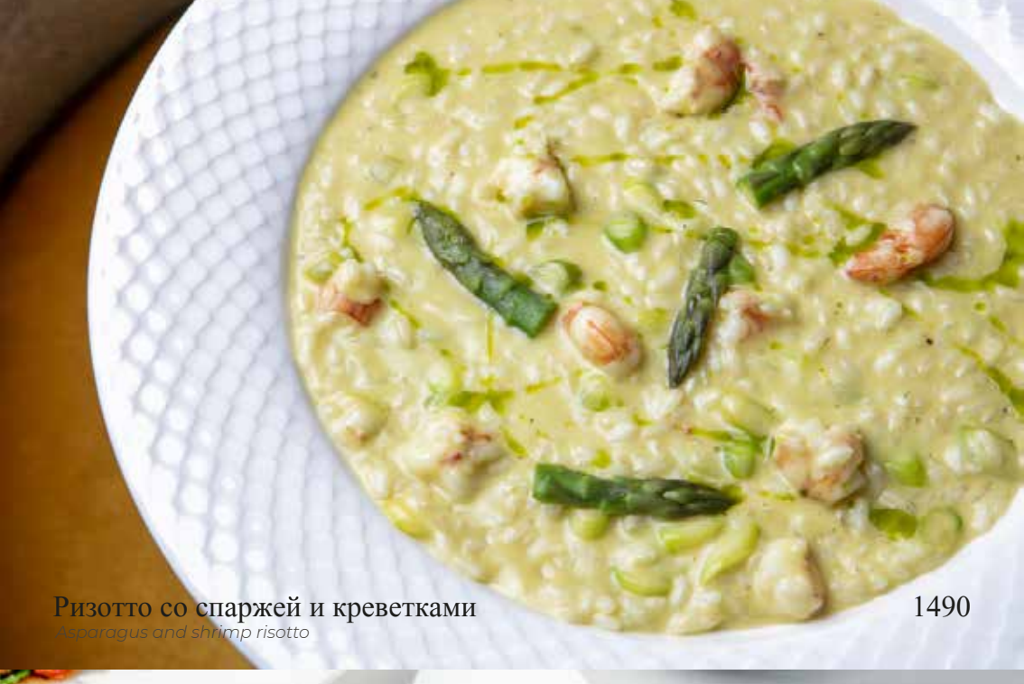
Ризотто со спаржей и креветками Asparagus and shrimp risotto