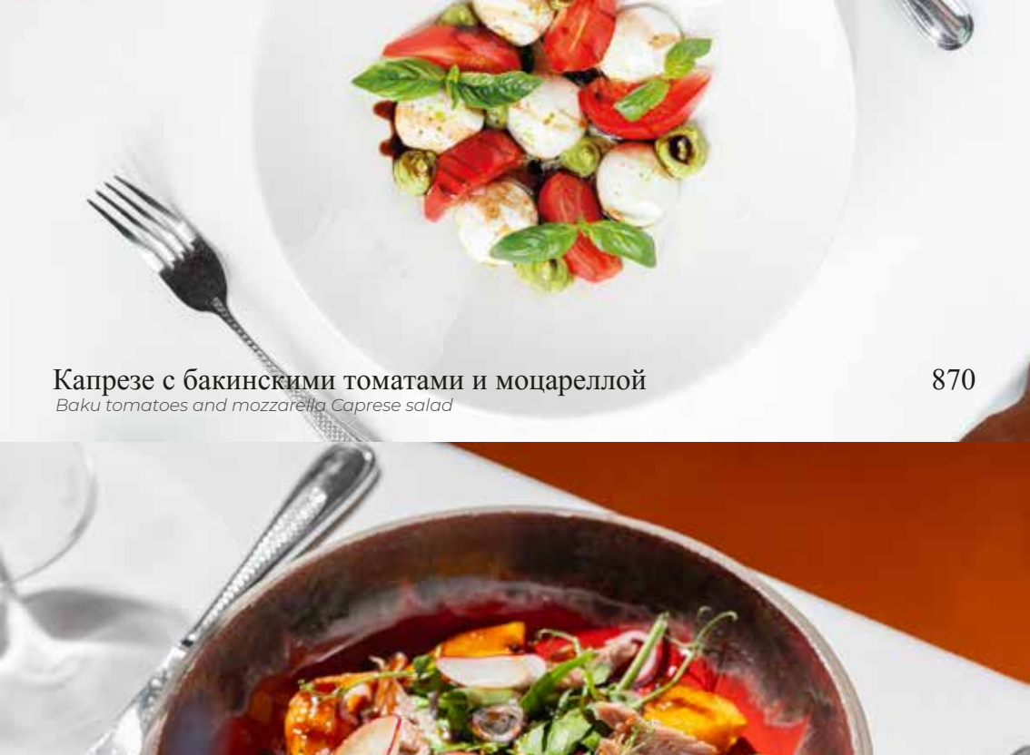
Капрезе с бакинскими томатами и моцареллой

Baku tomatoes and mozzarella Caprese salad