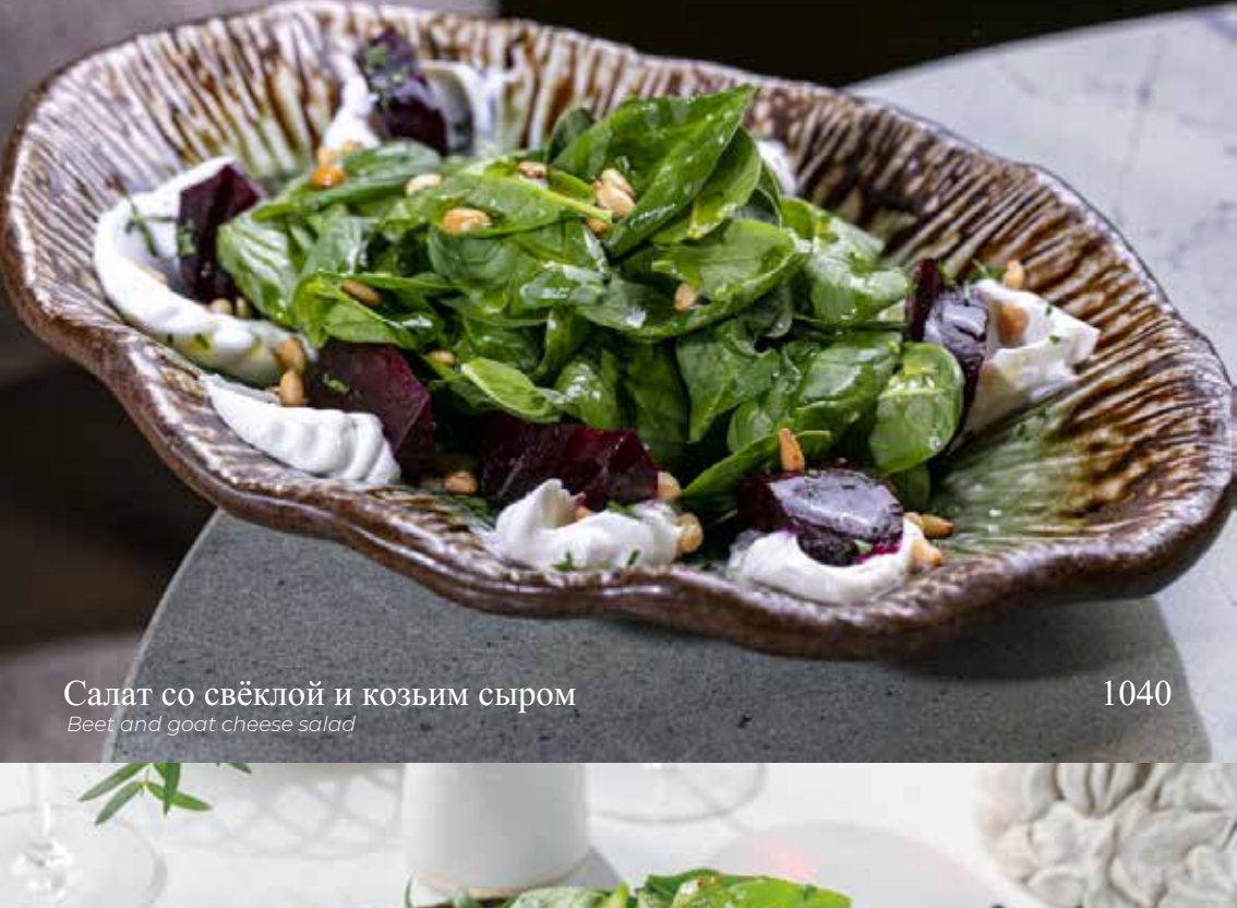
Салат со свёклой и козьим сыром