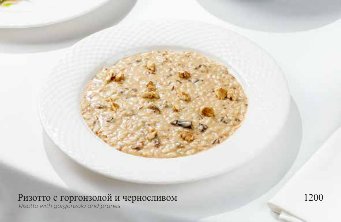
Ризотто с горгонзолой и черносливом Risotto with gorgonzola and prunes