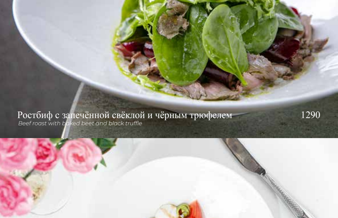
Ростбиф с запечённой свёклой и чёрным трюфелем

Beef roast with baked beet and black truffle