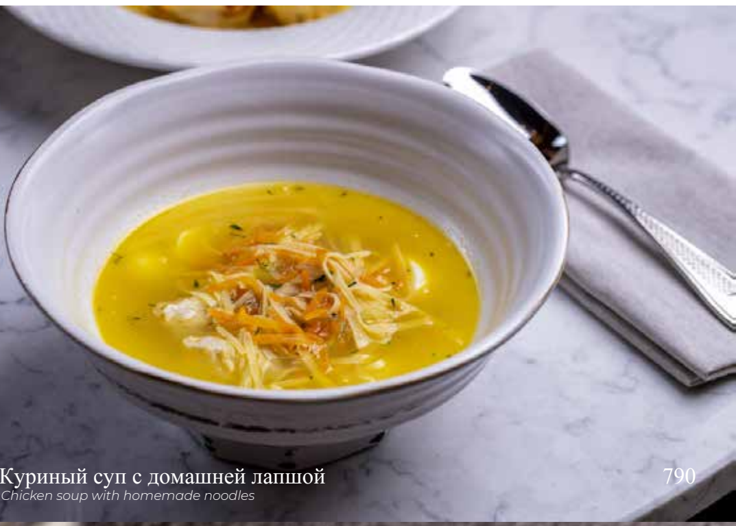
Куриный суп с домашней лапшой Chicken soup with homemade noodles