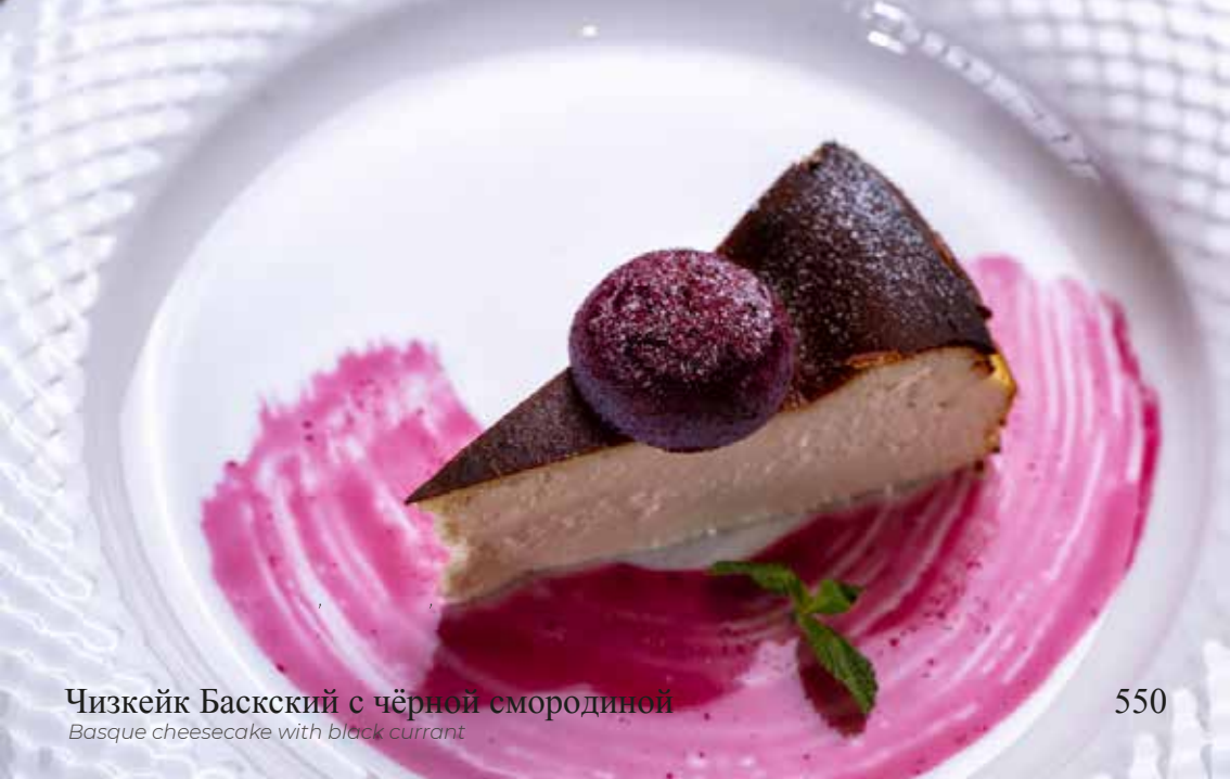
Чизкейк Баскский с чёрной смородиной