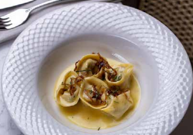
Равиоли с белыми грибами