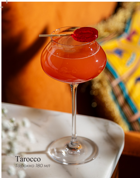
Tarocco Тарокко 180 мл