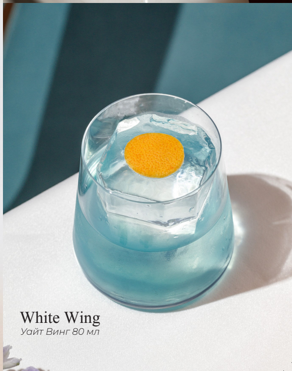
White Wing Уайт Винг 80 мл