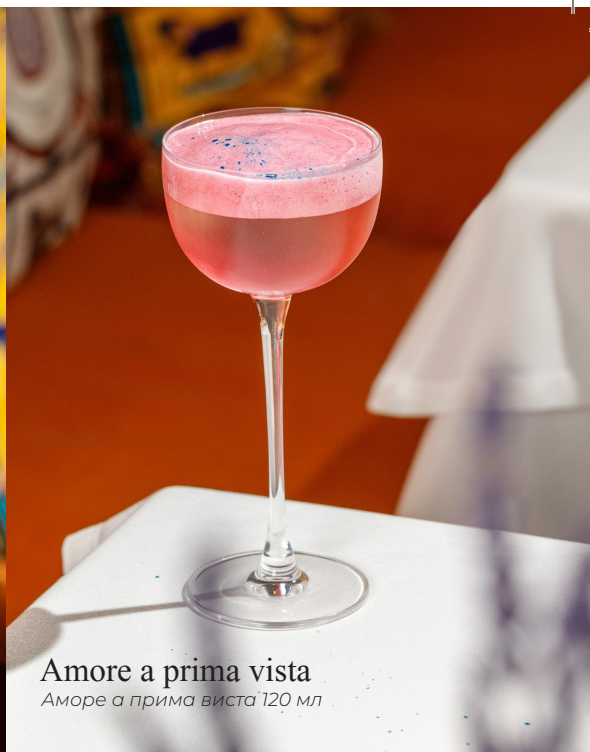
Amore a prima vista Аморе а прима виста 120 мл