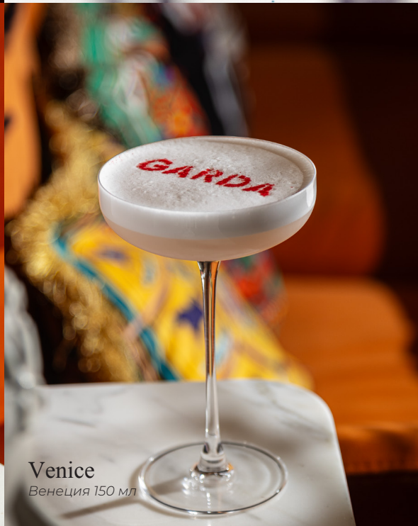
Venice Венеция 150 мл