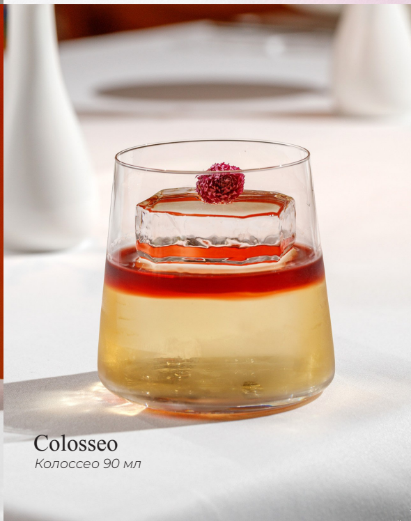
Colosseo Колоссео 90 мл