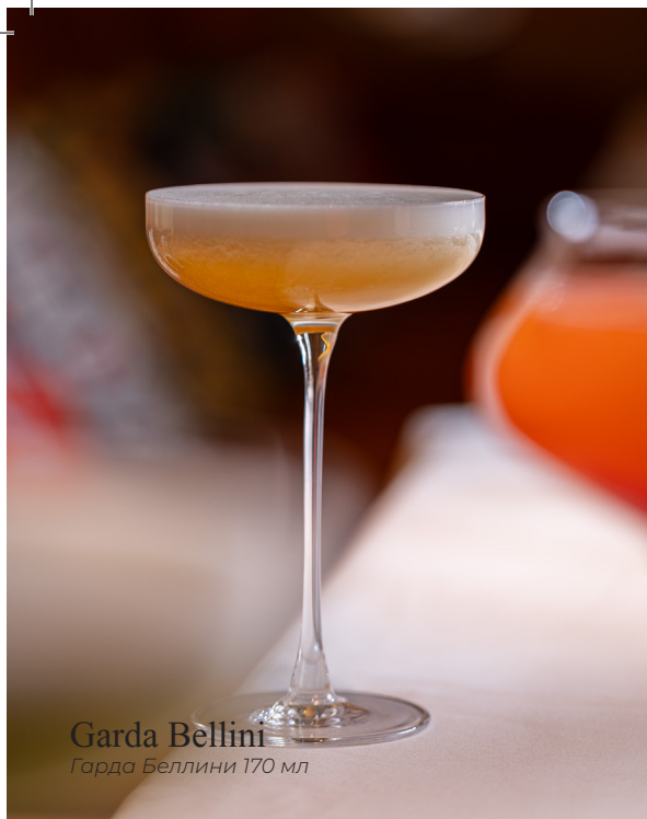
Garda Bellini Гарда Беллини 170 мл