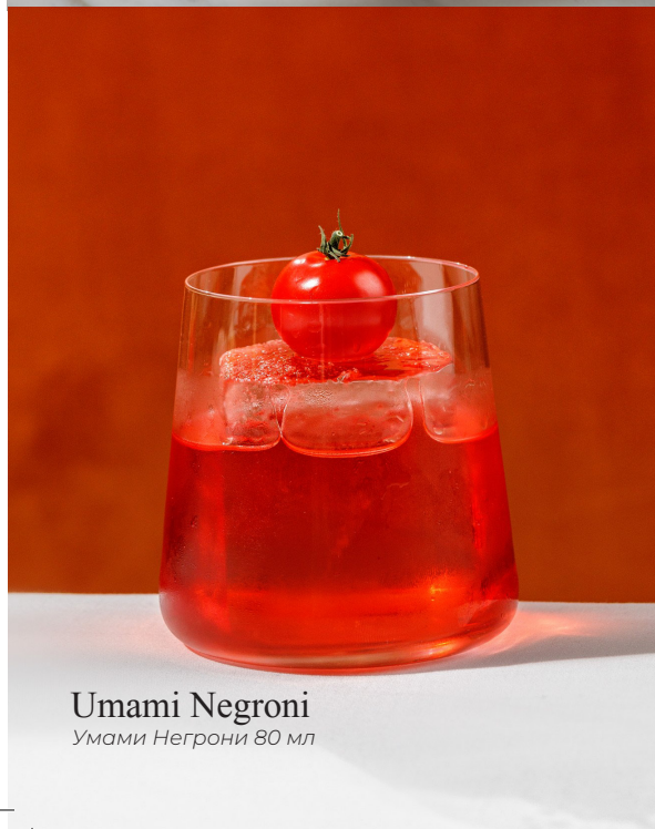
Umami Negroni Умами Негрони 80 мл