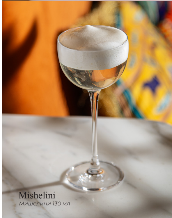
Mishelini Мишеллини 130 мл