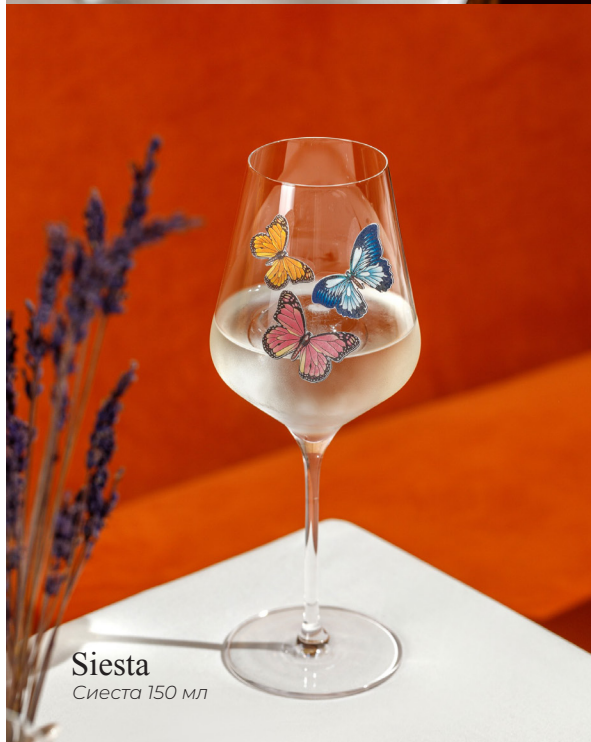
Siesta Сиеста 150 мл