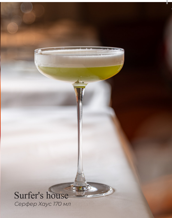
Surfer's house Серфер Хаус 170 мл