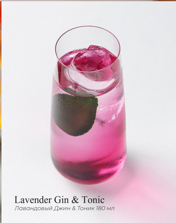
Lavender Gin & Tonic Лавандовый Джин & Тоник 180 мл