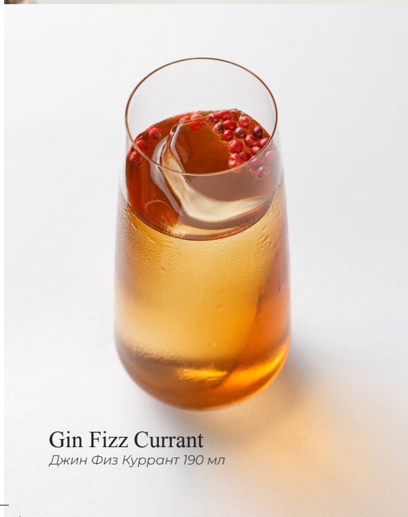
Gin Fizz Currant Джин Физ Куррант 190 мл